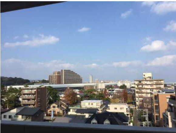
【その他】北側バルコニー(主寝室)からの眺望