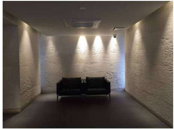
【ロビー】落ち着いたロビーが来客を迎えます