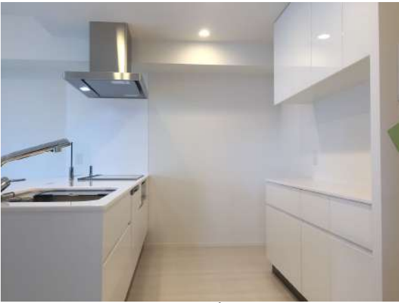
【キッチン】カップボード付き