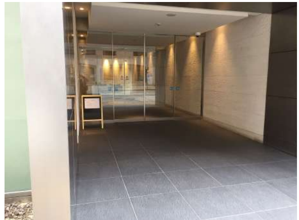
【エントランス(外)】上品なエントランス