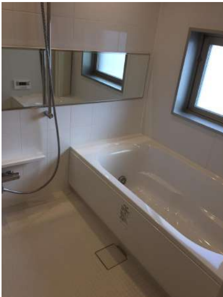
【浴室】1620サイズのゆったりしたユニットバス