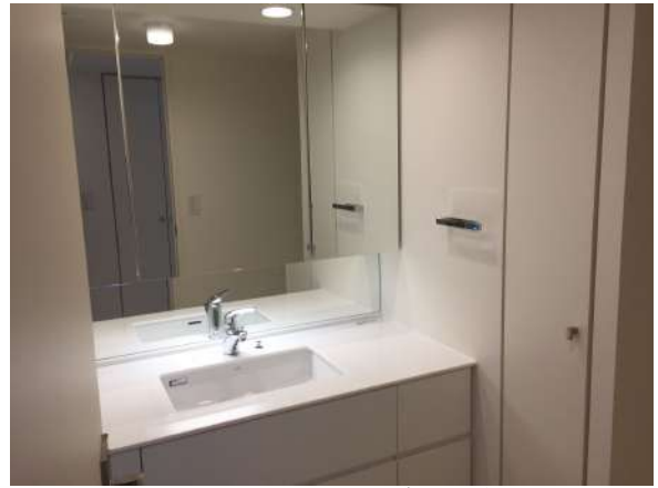
【洗面化粧台】3面鏡を開けば収納があります