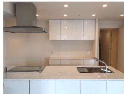
【キッチン】ダウンライトで手元も明るいキッチン