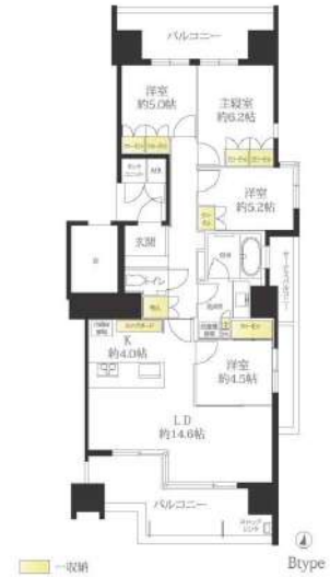
【間取り図】南東北3面角部屋 南北両面バルコニー