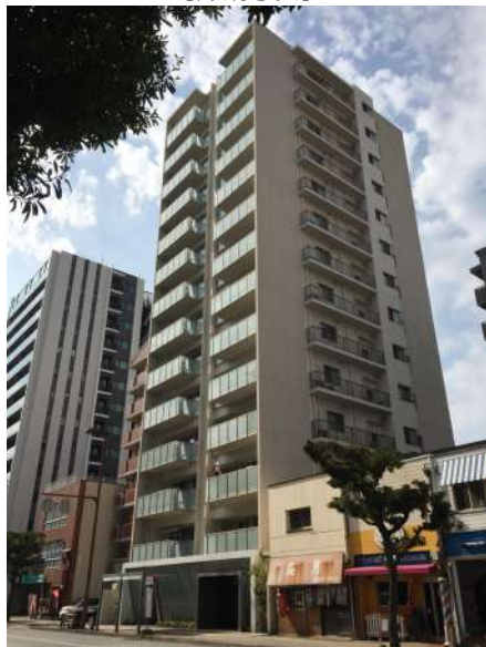
【外観写真】ワンフロア2邸