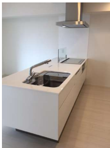
【キッチン】開放的な対面式キッチン