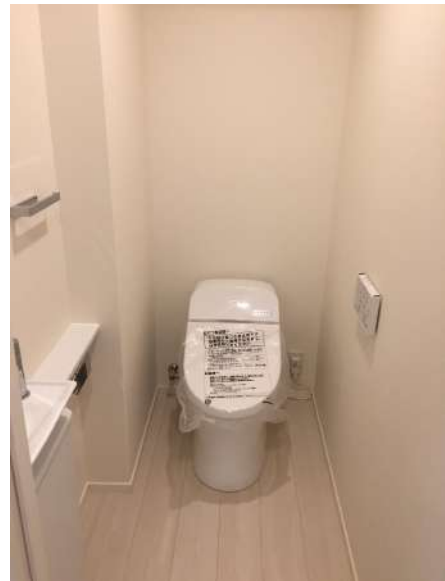
【トイレ】手洗いカウンター付