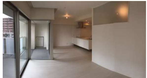
【リビングダイニング】南向きで明るいLDK