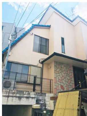
【外観写真】周囲は静かな住宅地です