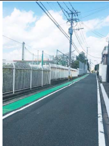
【その他】目の前は県立福岡中央高校です