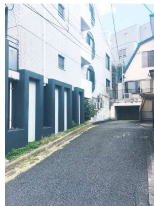
【外観写真】2台駐車可能です(車高、車幅、車種によります)