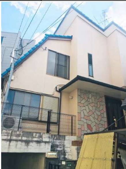
【外観写真】周囲は静かな住宅地です