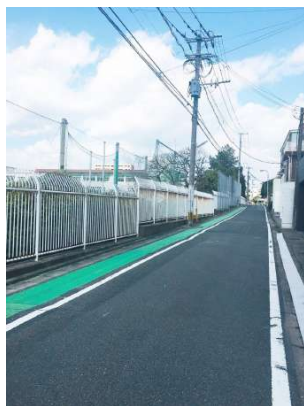
【その他】目の前は県立福岡中央高校です