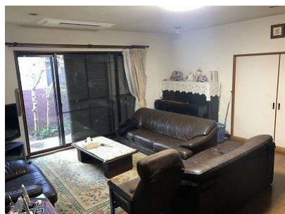
【リビングダイニング】LD18.2帖