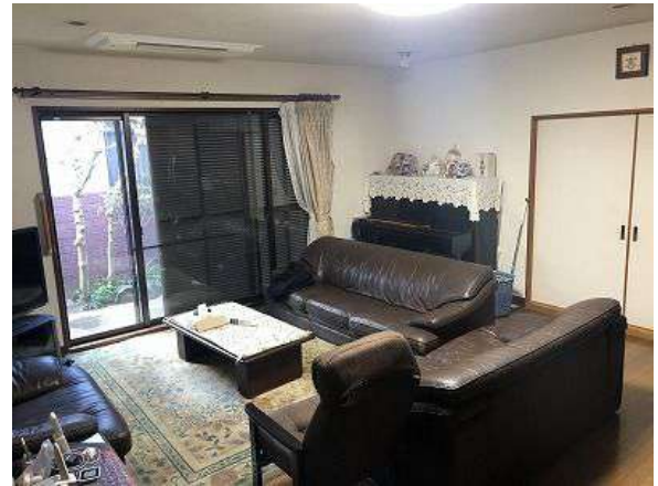
【リビングダイニング】LD18.2帖