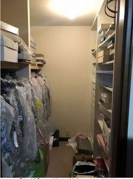
【収納】9.2帖の洋室にある納戸