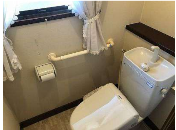
【トイレ】10.9帖洋室側トイレ