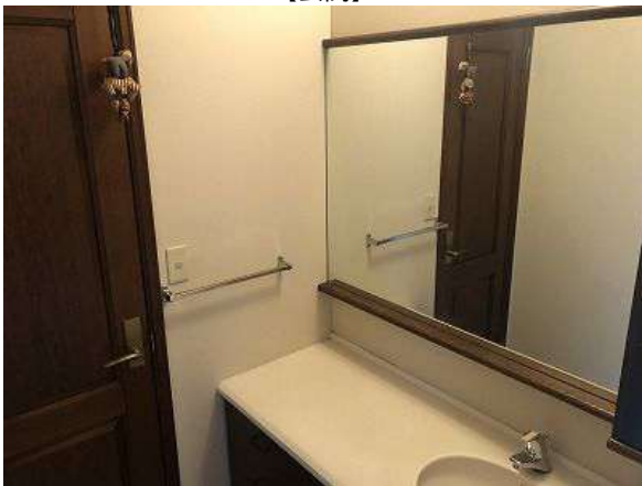
【洗面化粧台】10.9帖洋室前洗面化粧台