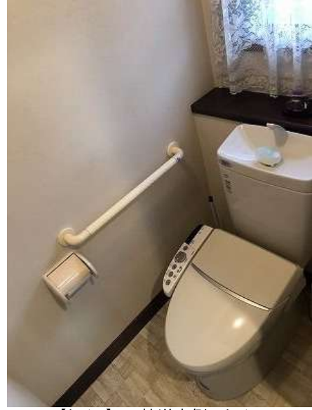
【トイレ】9.2帖洋室側のトイレ