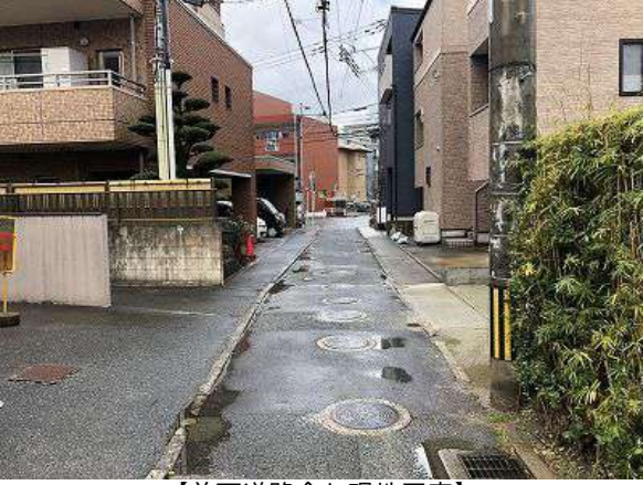
【前面道路合む現地写真】