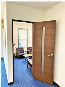
【その他設備】☆応接室入口☆