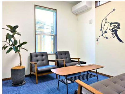
【その他設備】☆応接室☆