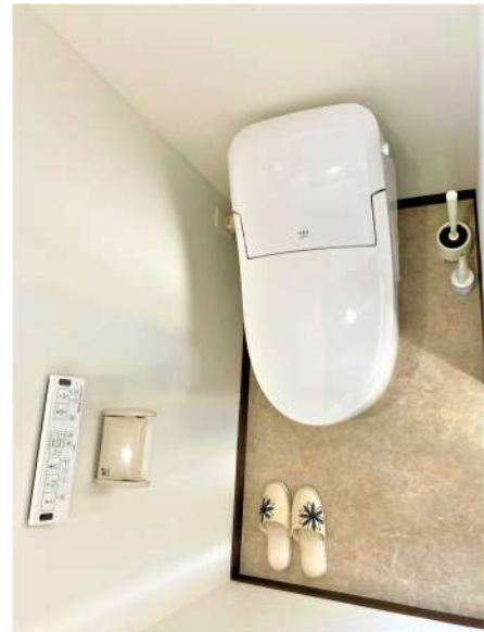
【その他設備】☆タンクレストイレ☆