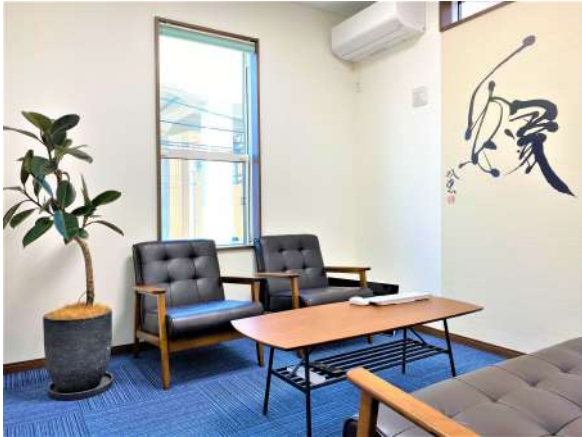
【その他設備】☆応接室☆