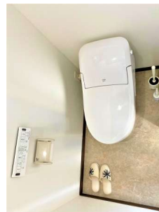
【その他設備】☆タンクレストイレ☆