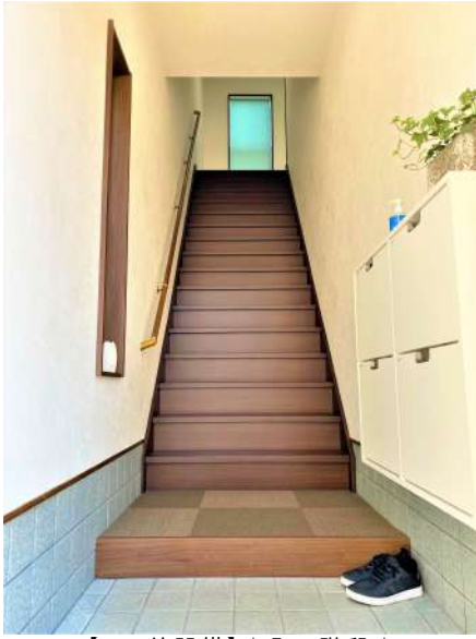
【その他設備】☆入口階段☆