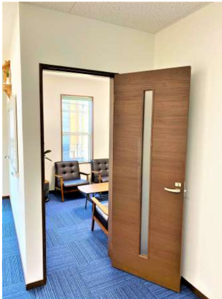
【その他設備】☆応接室入口☆