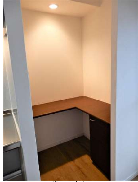
キッチン横には家事スペース