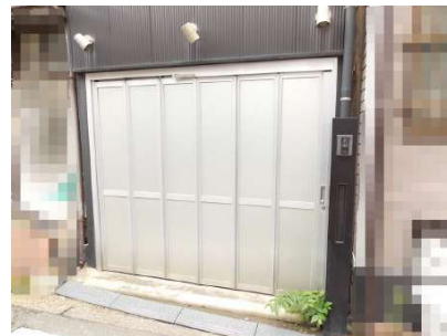
【現況外観写真】1Fバイクガレージ