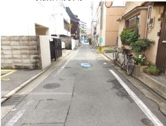
【前面道路含む現地写真】前面道路