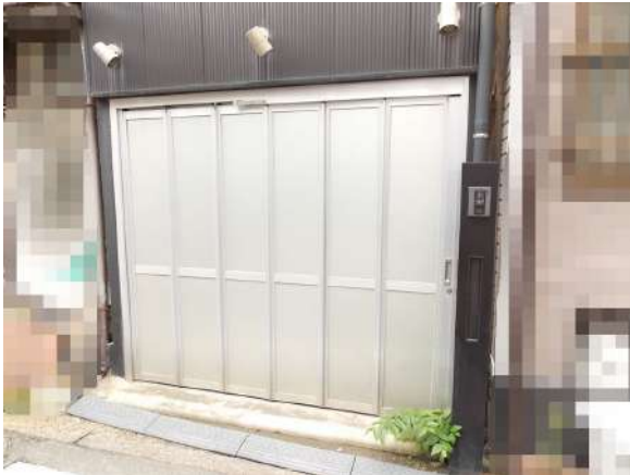
【現況外観写真】1Fバイクガレージ