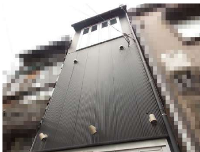
【外観写真】鉄骨造4F建