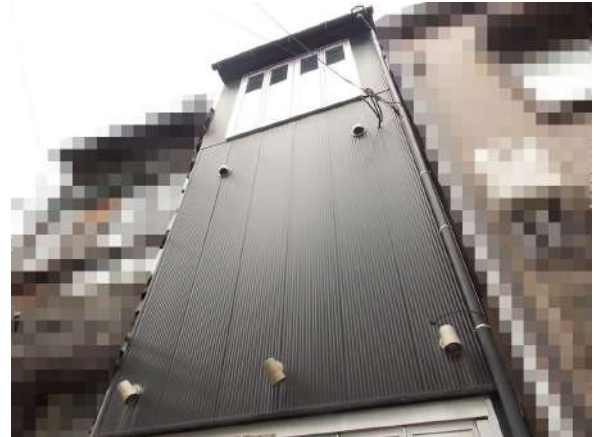
【外観写真】鉄骨造4F建