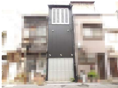
【外観写真】平成21年に内外装リフォーム