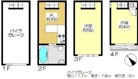
【間取り図】1F:バイクガレージ付、2F:水廻り