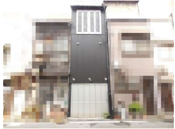
【外観写真】平成21年に内外装リフォーム