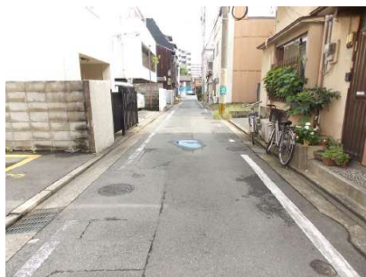
【前面道路含む現地写真】前面道路