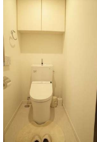
【トイレ】清潔感のあるお手洗い。