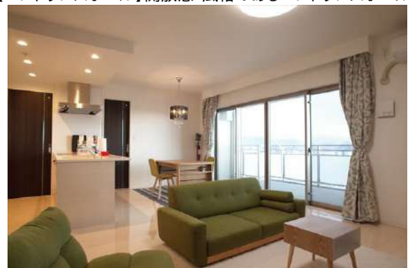
【リビングダイニング】大きなサッシが明るい光と風を届けます。