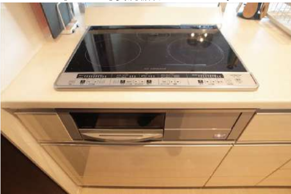
【キッチン】お掃除楽々なIHクッキングヒーター。