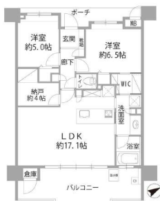
【間取り図】間取り変更して広々なLDK。約4帖の納戸。