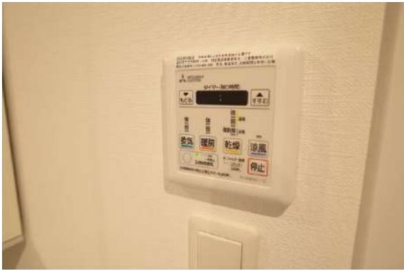
【その他設備】浴室には暖房換気乾燥機付き。