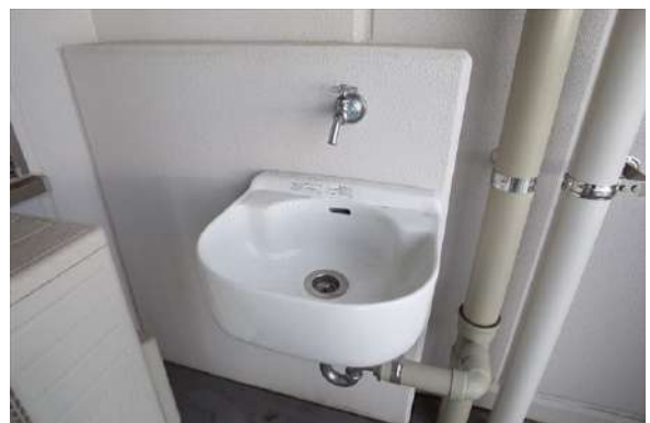
【その他設備】バルコニーにはスロップシンクも。