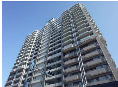
【外観写真】圧倒的な存在感!!毎日家に帰るのが楽しみです。