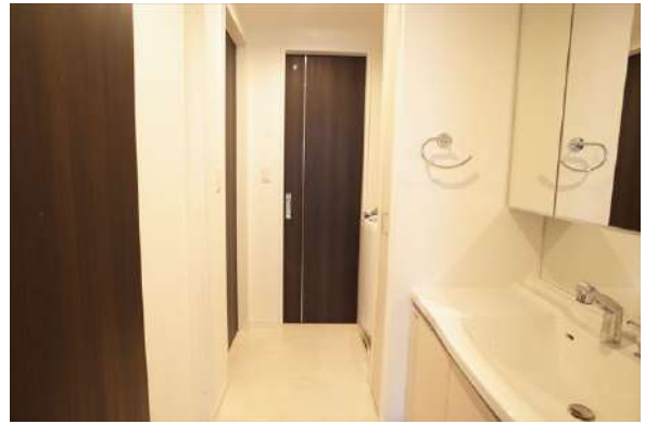
【脱衣場】広々とした脱衣室。