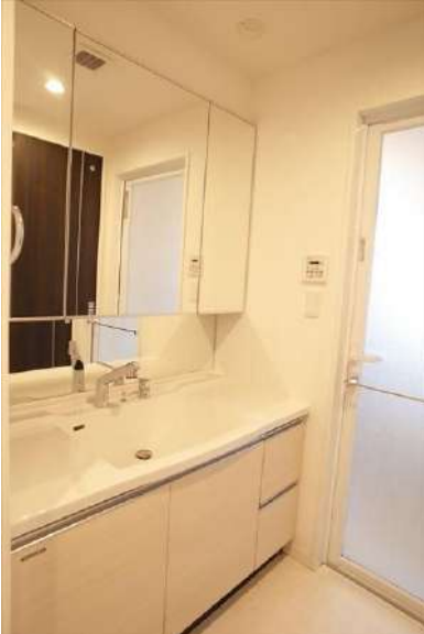
【洗面化粧台】大きな三面鏡付きのドレッサー。