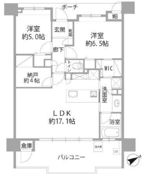
【間取り図】間取り変更して広々なLDK。約4帖の納戸。