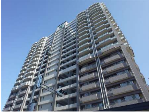
【外観写真】圧倒的な存在感!!毎日家に帰るのが楽しみです。