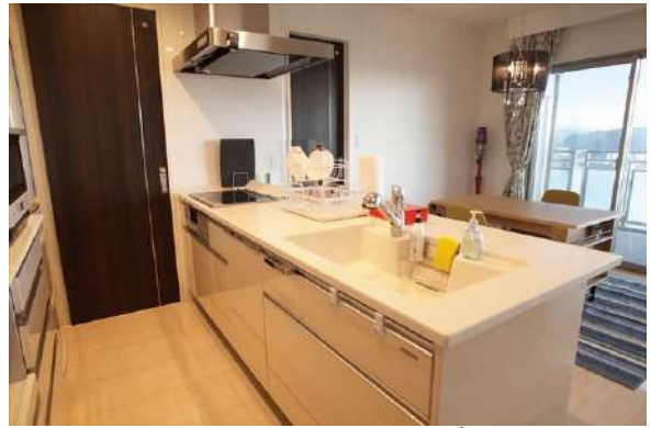
【キッチン】人造大理石天板のオープンキッチン。