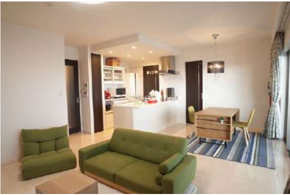
【リビングダイニング】スッキリ広々とした印象のLDK。