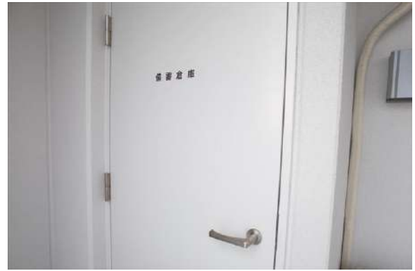
【収納】バルコニーのトランクルーム。