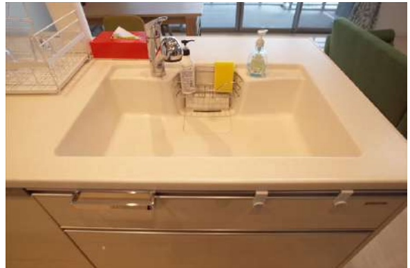
【キッチン】シームレスのシンク。