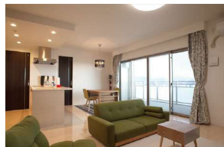
【リビングダイニング】大きなサッシが明るい光と風を届けます。