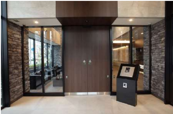
【エントランスホール】石・木目・ガラスが美しい天井の高いエントランスホール。