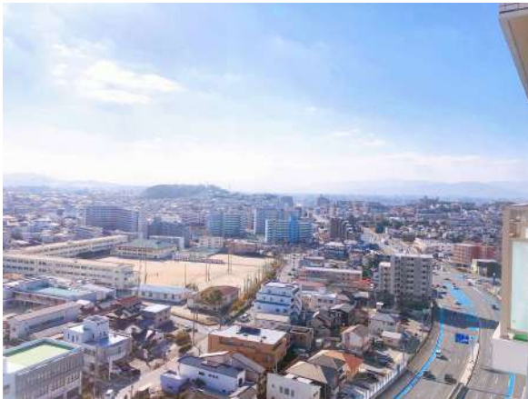
【眺望】最上階(19階)からの景色は絶景です!