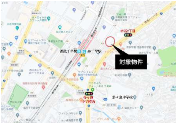
【地図】JR・西鉄「千早」駅徒歩2分。駅建物内に飲食店等多数出店。