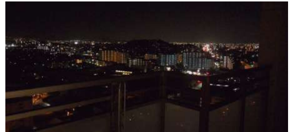
【眺望】夜景も美しいです。