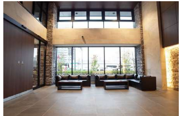
【エントランスホール】開放感・風格のあるエントランスホール。