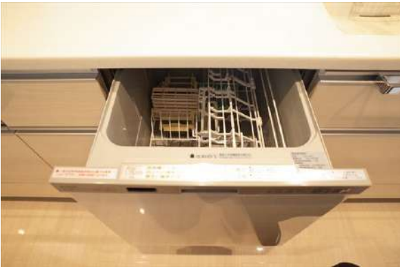
【キッチン】食洗機付きのキッチン。