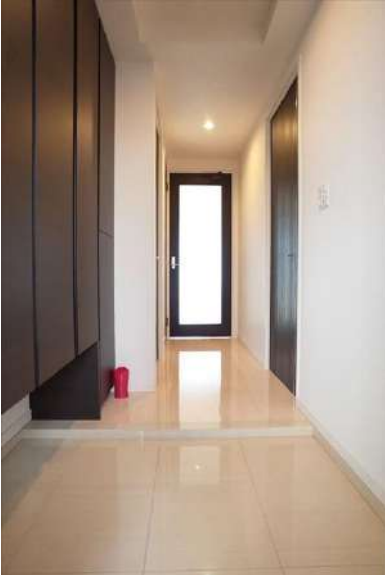
【玄関】石貼りの高級感ある玄関。