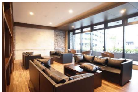
【ロビー】広々としたロビーです。