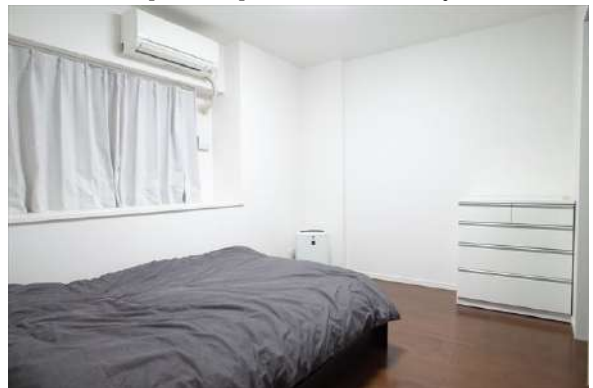
【洋室】形の良い6.5帖の寝室。