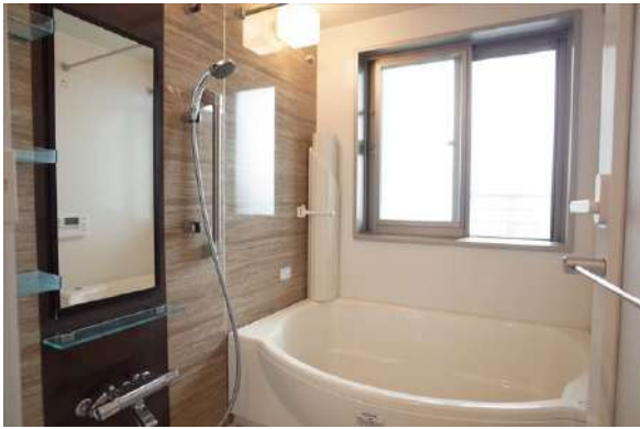
【浴室】ワイド浴槽でゆったり入浴できます。