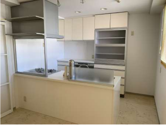
【ダイニングキッチン】