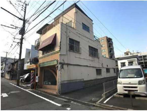
【現況写真】現地写真