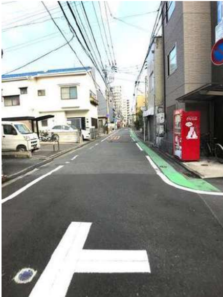
【前面道路含む現地写真】前面道路