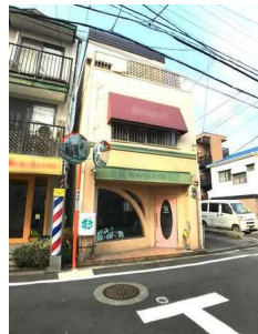
【現況写真】現地写真