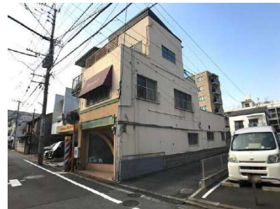
【現況写真】現地写真