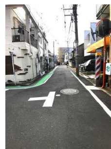
【前面道路含む現地写真】前面道路