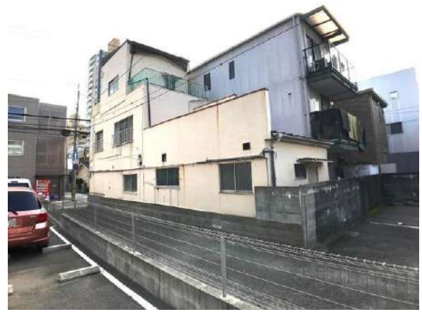
【現況写真】現地写真