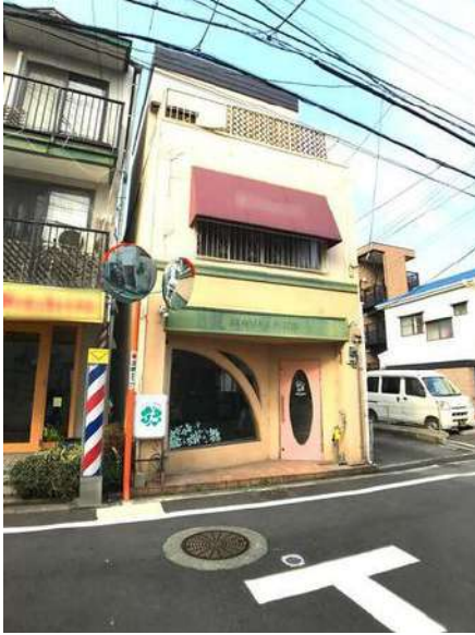
【現況写真】現地写真