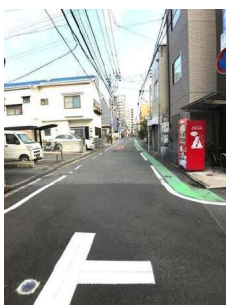
【前面道路含む現地写真】前面道路