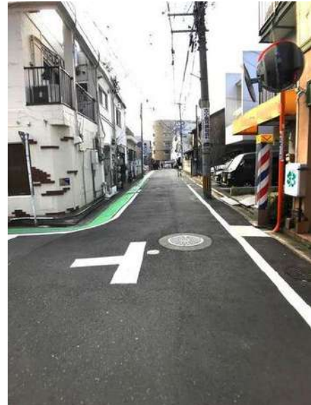
【前面道路含む現地写真】前面道路