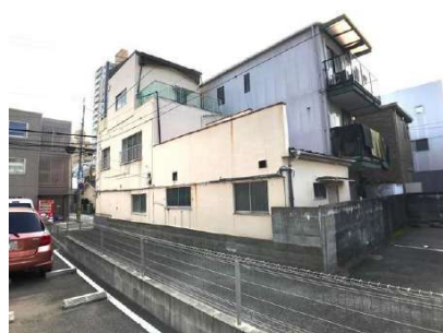
【現況写真】現地写真