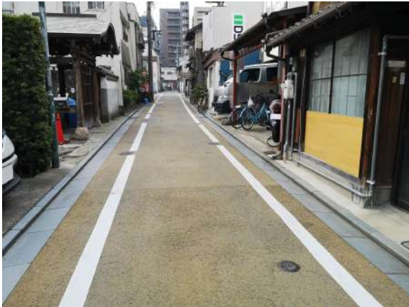
【前面道路含む現地写真】前面道路