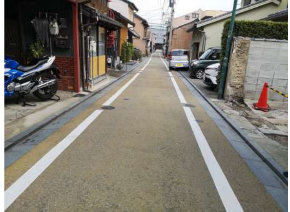
【前面道路含む現地写真】前面道路