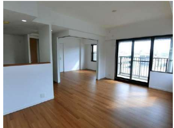
【リビングダイニング】