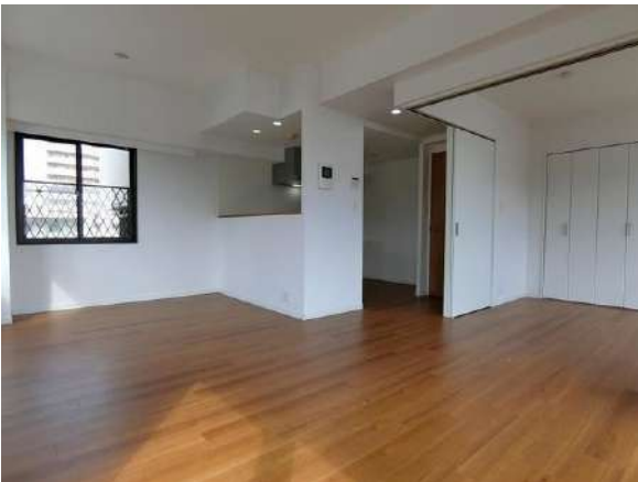
【リビングダイニング】