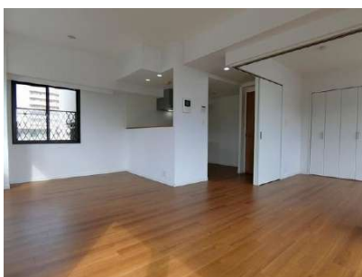
【リビングダイニング】