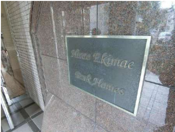
【その他】エンブレム