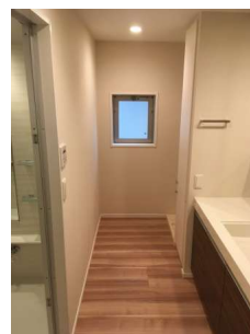
【脱衣場】パウダールーム