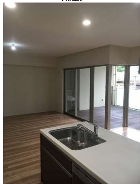
【居間・リビング】キッチンから