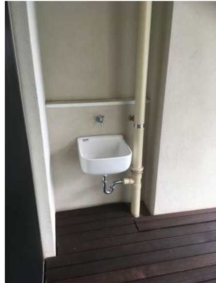
【バルコニー】スロップシンク