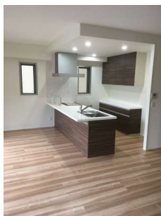
【キッチン】キッチン全景