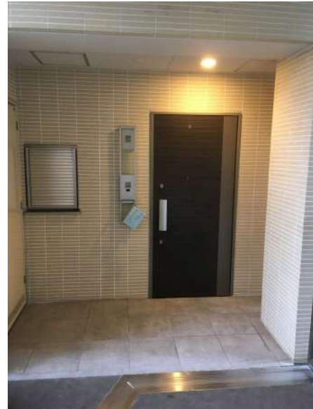
【玄関】玄関ドア・アルコーブ