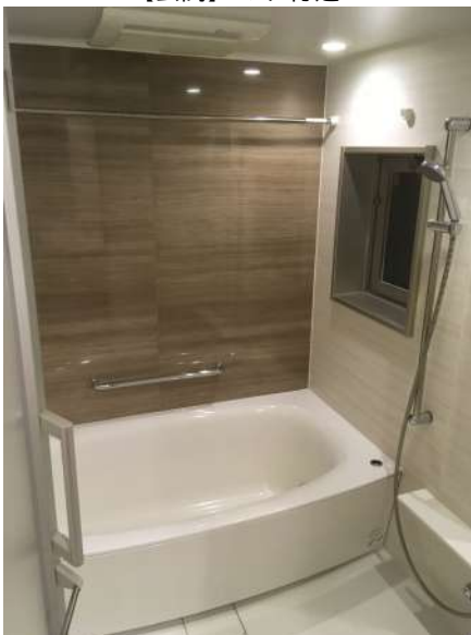
【浴室】バスルーム1620サイズ