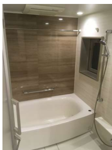
【浴室】バスルーム1620サイズ