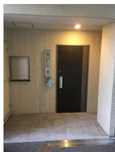
【玄関】玄関ドア・アルコーブ