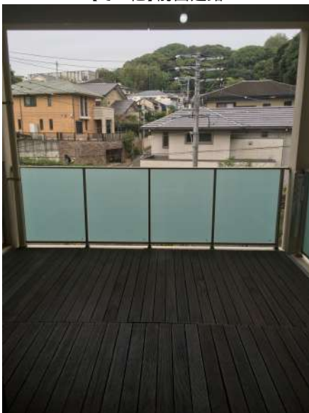
【眺望】バルコニーから