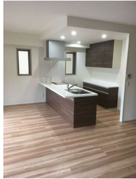
【キッチン】キッチン全景