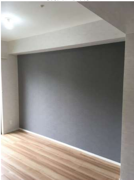
【洋室】アクセントクロスあり