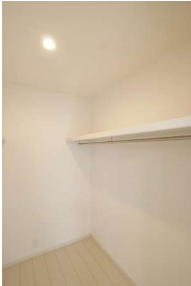
【ウォークインクローゼット】