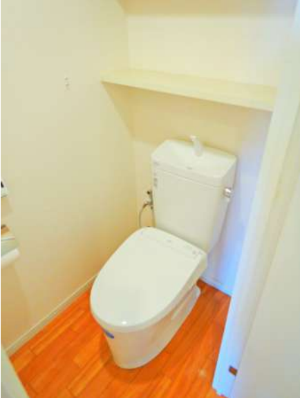
【トイレ】トイレもちろん最新式のものに変更