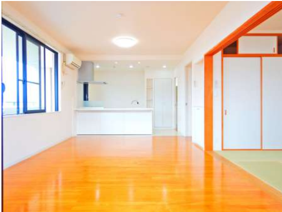
【居間・リビング】バルコニーに2面接面&続間の和室で、空間の広がりを感じる場所