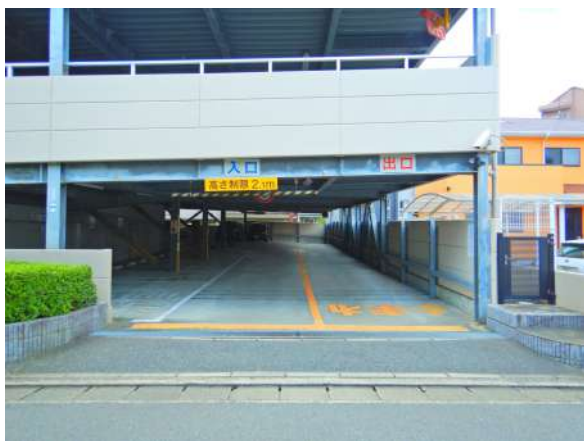
【敷地内駐車場】高さ2.1m。ほぼ全ての車種に対応。