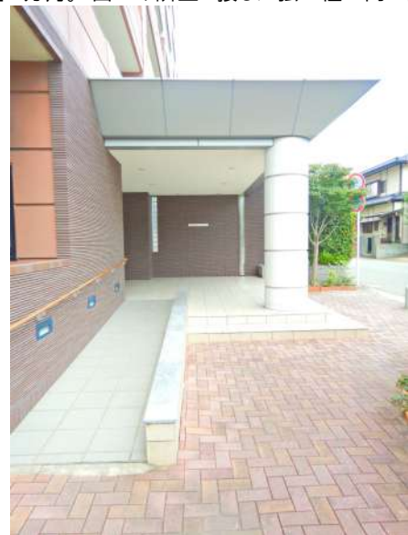
【エントランス(外)】スロープがあって車イスのかたも安心です。