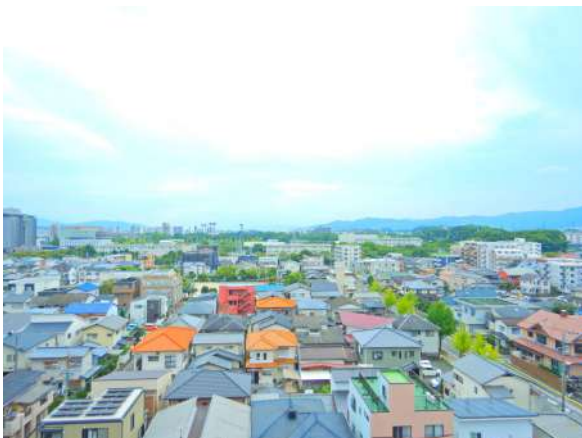
【眺望】南東側眺望。見事に抜けた景色です。