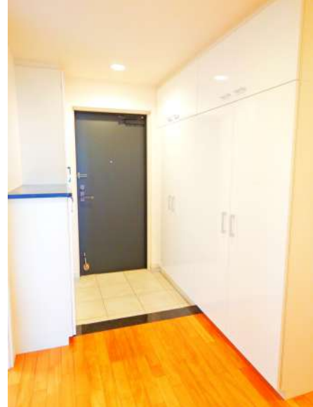
【玄関】玄関は左右に大きなシューズボックス。大家族でも大丈夫!