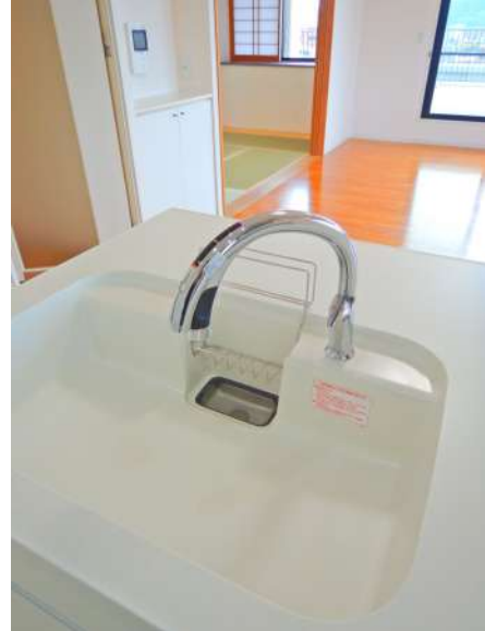
【キッチン】あこがれの非接触センサー付き水栓!