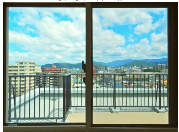
【眺望】主寝室からの眺め(北東側)