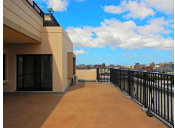
【バルコニー】南西側眺望。直近は戸建エリアにつき気持ちいい景色