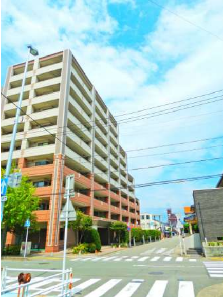
【外観写真】2丁掛けタイルの高級感あふれる外装!南方向は低層住宅