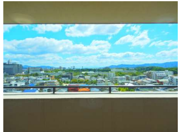
【眺望】リビング室内ガラス越からの眺望!