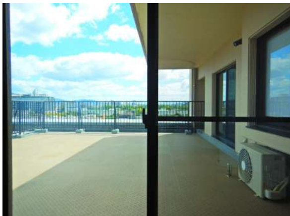
【玄関】主寝室からの眺め(南東側)