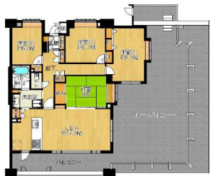
【間取り図】3方角。1面のみ隣室と接した独立性の高い間取りです。