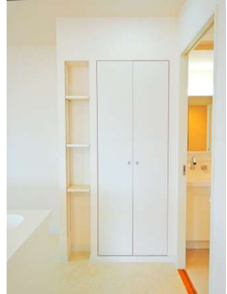
【キッチン】キッチンスペースにはパントリーと収納棚。