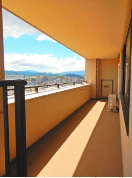
【バルコニー】キッチン側のバルコニー。奥に勝手口と物干しが見えます。