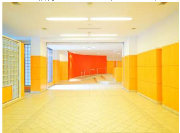
【エントランスホール】奥行ある。清潔なエントランスホール。