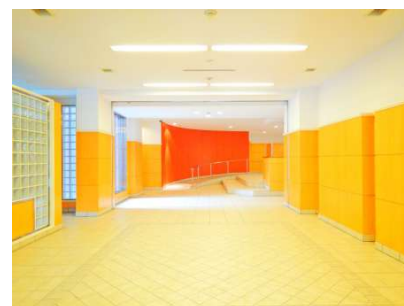
【エントランスホール】奥行ある。清潔なエントランスホール。