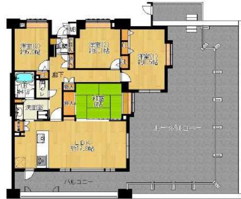
【間取り図】3方角。1面のみ隣室と接した独立性の高い間取りです。