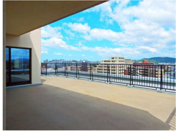
【バルコニー】めちゃ広RBL! 実は共用廊下側からも出入り可能で、かなり便利