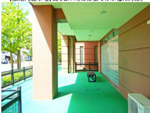
【その他共用部】外に面した共用プレイルーム