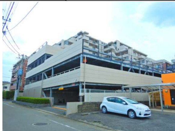
【敷地内駐車場】敷地に建つ駐車棟は、全数平置き!屋根あり区画も45あります。