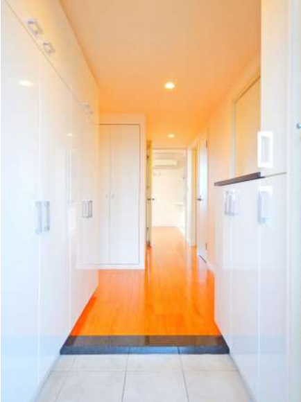
【玄関】白を基調とした建具と優しい色味の床です。