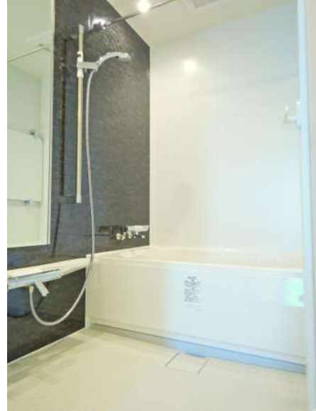
【浴室】落ち着いた色合いの清潔感あふれる浴室。