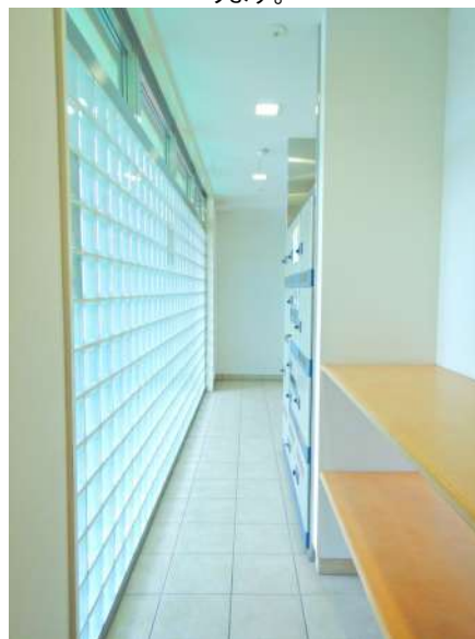
【郵便受け】集合郵便受け