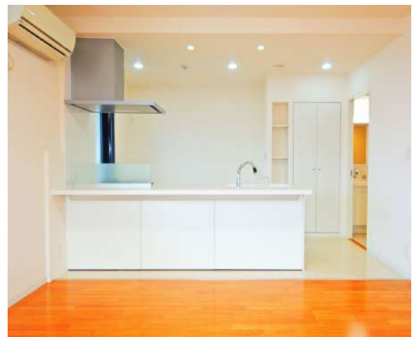
【キッチン】天井まで広々!フルオープンキッチン。洗面室からの動線グッド