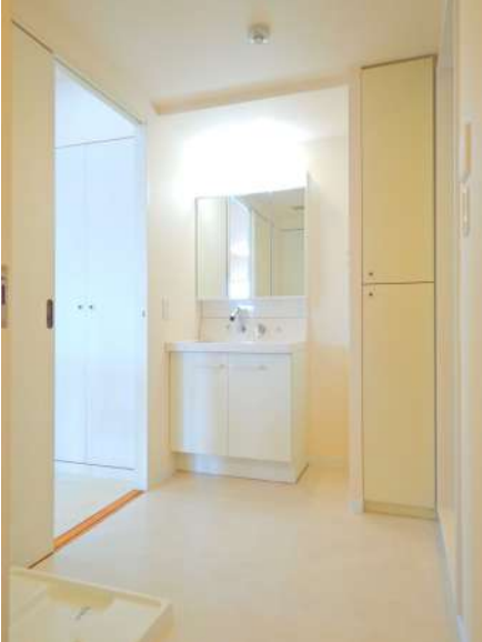
【脱衣場】リネン庫あり。廊下側・キッチン側双方から出入り可能です。