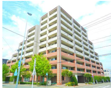
【外観写真】3面が道路に面した開放的な敷地で