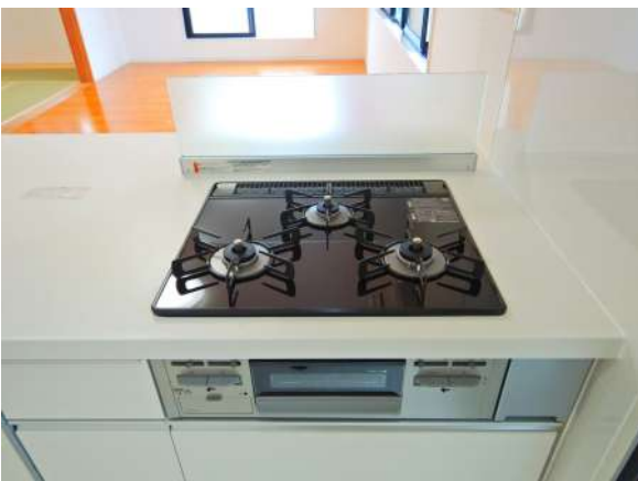
【キッチン】料理が楽しい! ガラスパネルですっきりまとめたコンロ回り。