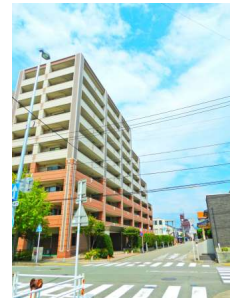
【外観写真】2丁掛けタイルの高級感あふれる外装!南方向は低層住宅