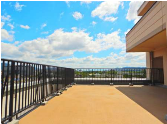
【バルコニー】南東側。クローバーホールや春日公園の緑が目に入ります