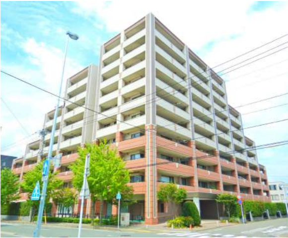
【外観写真】3面が道路に面した開放的な敷地です。