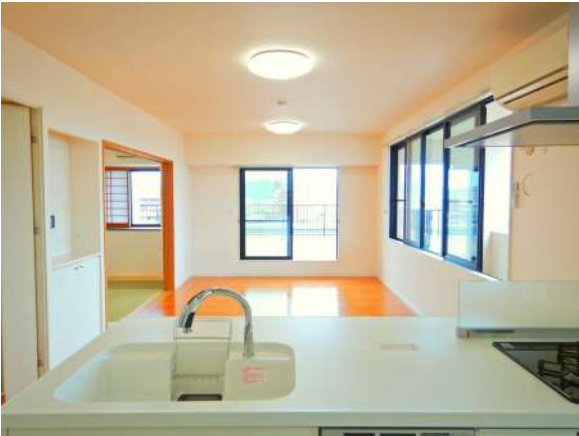
【居間・リビング】和室まで見通し良く小さなお子様のいる家庭も安心。