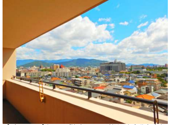
【バルコニー】キッチン側バルコニーだけでも十分な広さ