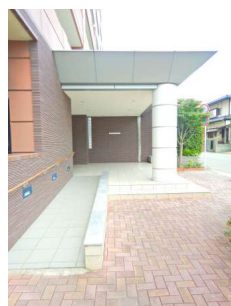
【エントランス(外)]スロープがあって車イスのかたも安心です。