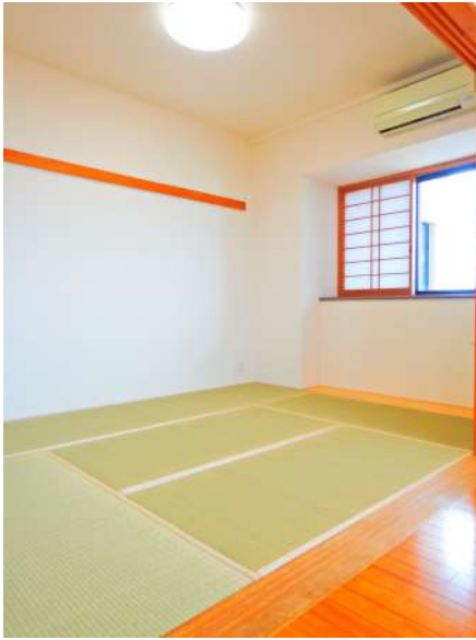
【和室】開放的に広々使えます。お子様の遊び場やゲストルームにもグッド