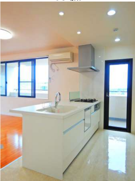
【キッチン】スポットライトがかっこいい!便利な勝手口のあるキッチン