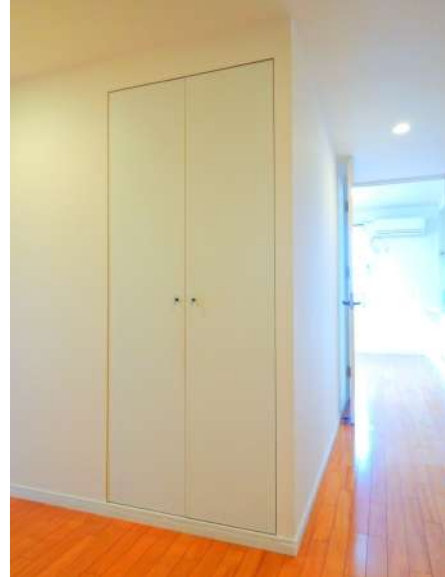
【収納】廊下にも大き目の収納あります。