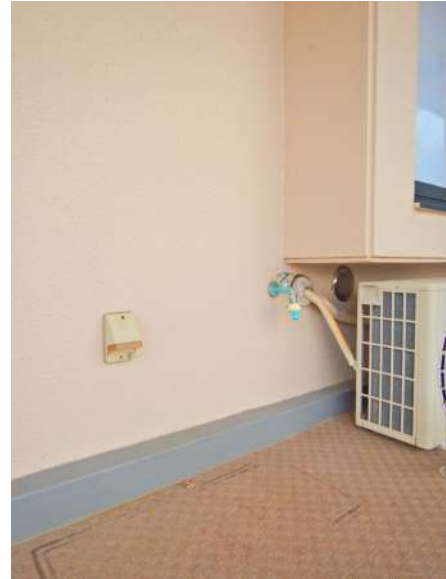
【バルコニー】バルコニーには水栓と電源もあります!