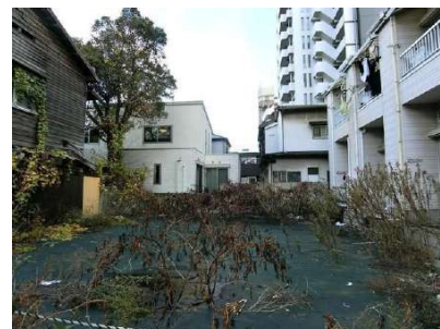
【現況写真】現地写真