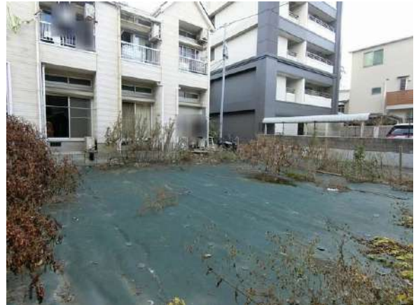
【現況写真】現地写真