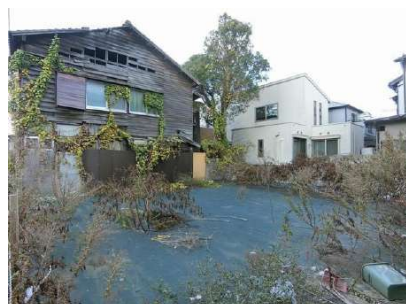
【現況写真】現地写真