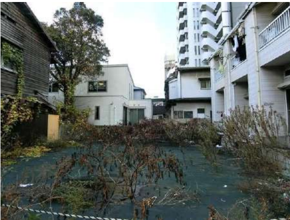
【現況写真】現地写真