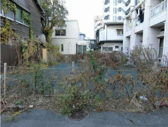
【現況写真】現地写真