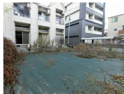
【現況写真】現地写真