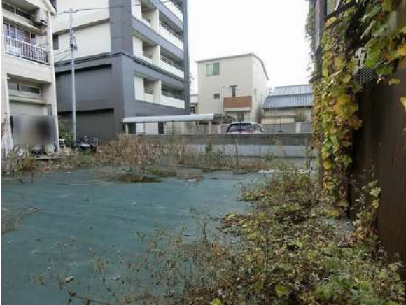
【現況写真】現地写真