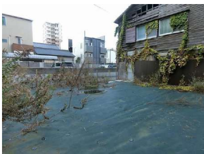
【現況写真】現地写真