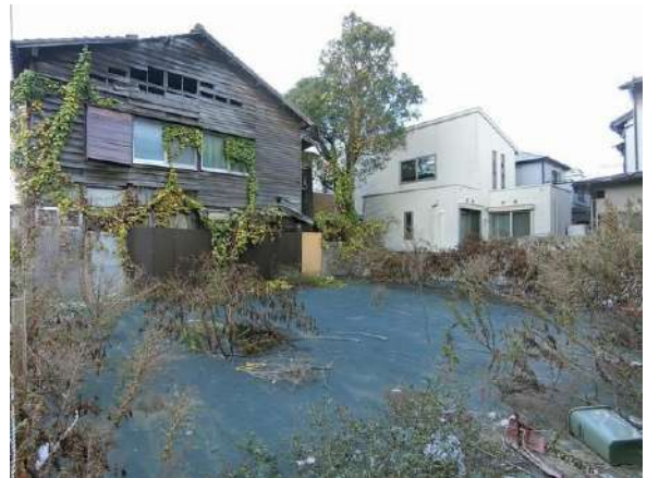
【現況写真】現地写真