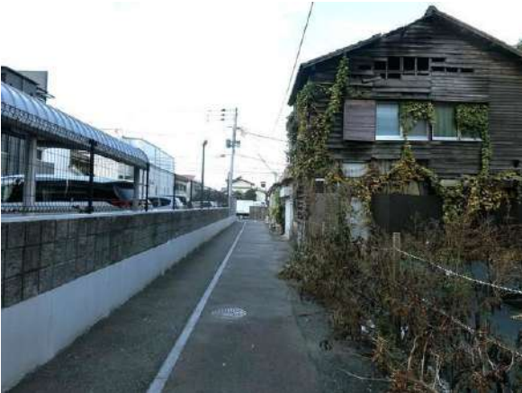
【前面道路含む現地写真】前面道路