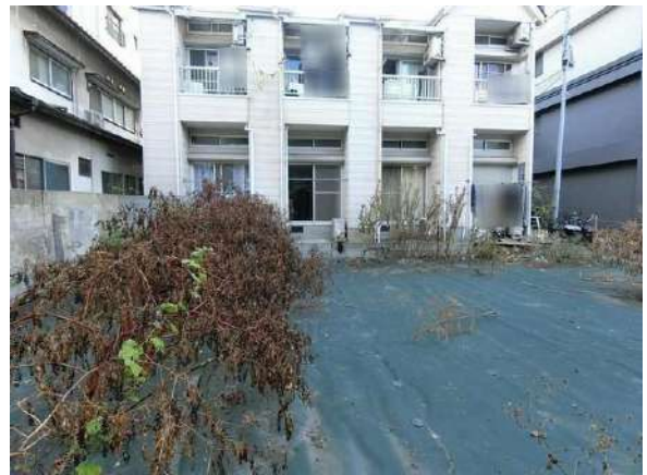
【現況写真】現地写真