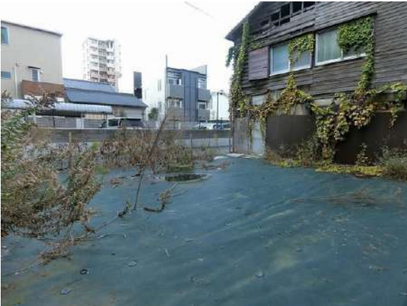
【現況写真】現地写真