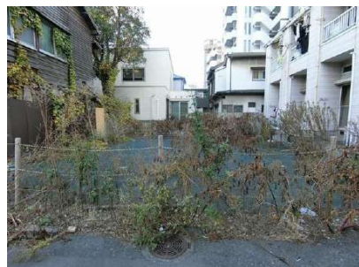
【現況写真】現地写真