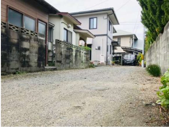
前面道路幅員約3.8m~4.0mです。