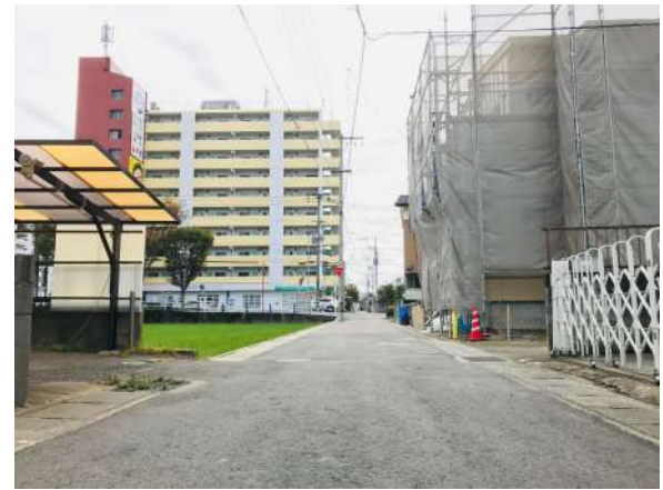
前面道路です。大通りから1本入った場所にあり閑静な立地です。