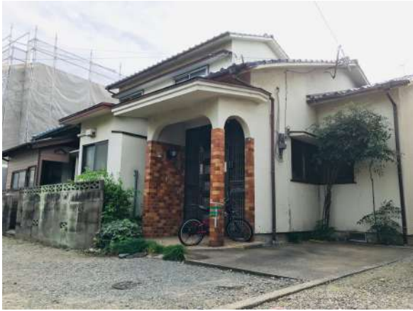
建築条件無しです。お好きなハウスメーカーで建築できます。