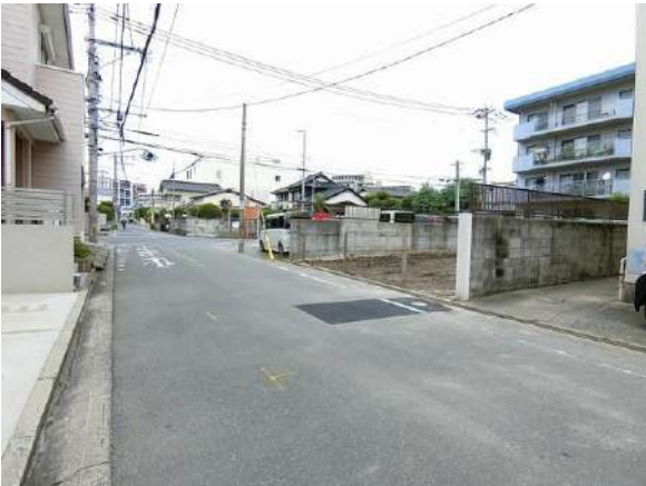
【前面道路含む現地写真】