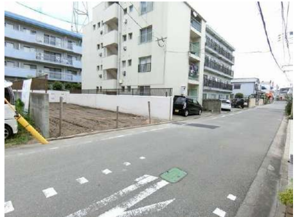
【前面道路含む現地写真】