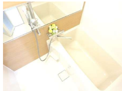
リクシル製ユニットバス入替。