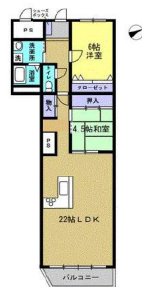
広々、22帖LDK。キッチン是对面式です。