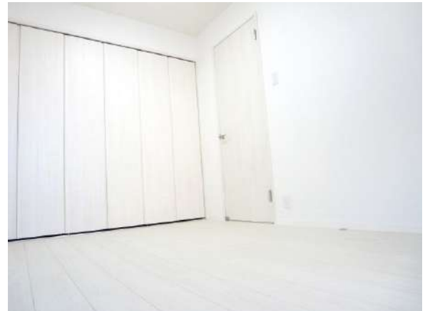
北側の洋室。クローゼットを新設。収納もばっちりです。