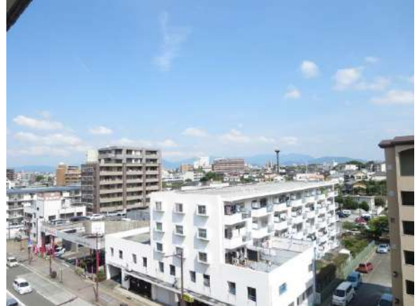
ベランダからの眺望。