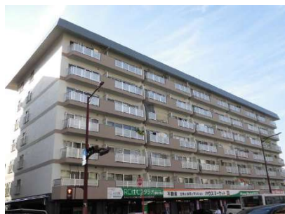
ダイヤハイツ野間、7階最上階で、眺望もイイですね。ベランダからの眺望。