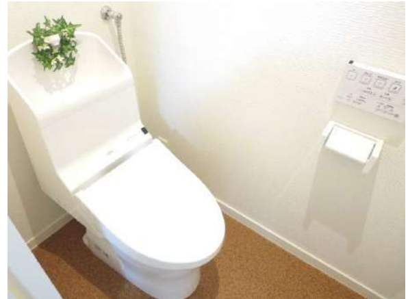
トイレも入替ました。壁リモコン式の使いやすいTOTOの製品