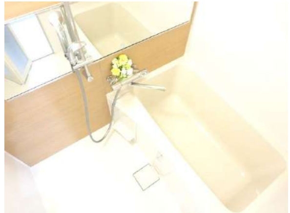
リクシル製ユニットバス入替。