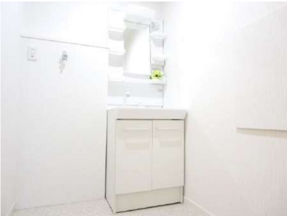
洗面化粧台も入れ替えました。朝のお支度も気持ちよく行えます。