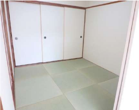
和室は大き目の扉を新設。畳は琉球畳を使用。