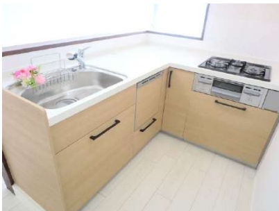
リクシル製システムキッチンも新品入替。食器洗浄機も内蔵