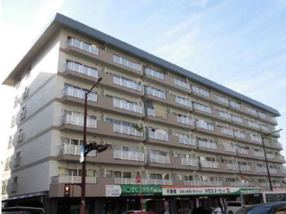
ダイヤハイツ野間、7階最上階で、眺望もイイですね。