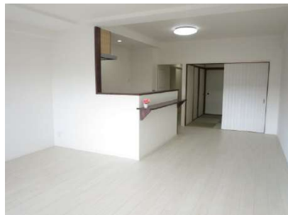
LDK。22帖で陽当りも良好。明るい一家団欒を楽しんで下さい