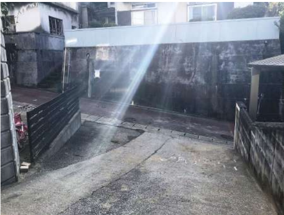
【前面道路含む現地写真】隔切りがあり接道約5.4mあり車も入りやすいです