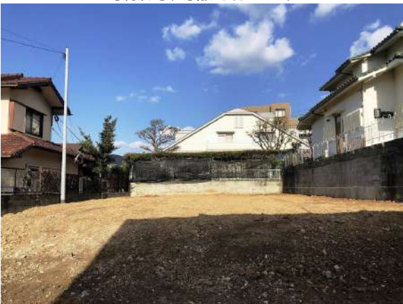
【現況写真】敷地約108坪