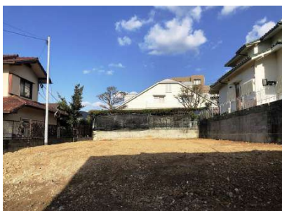
【現況写真】敷地約108坪