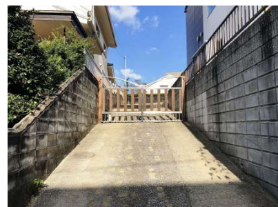
【現況写真】敷地進入路