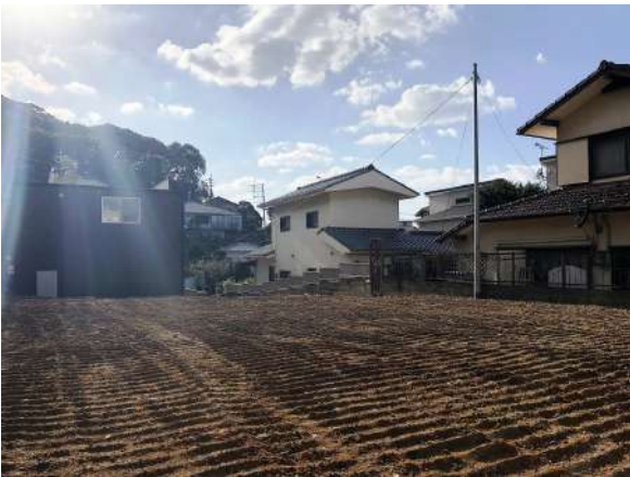
【現況写真】敷地約108坪