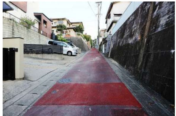
【前面道路含む現地写真】前面道路約3.6m