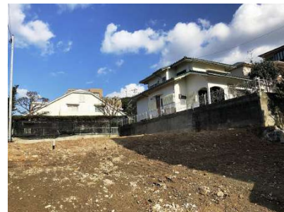
【現況写真】敷地約108坪