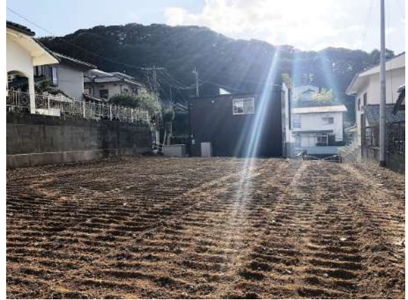
【現況写真】敷地約108坪