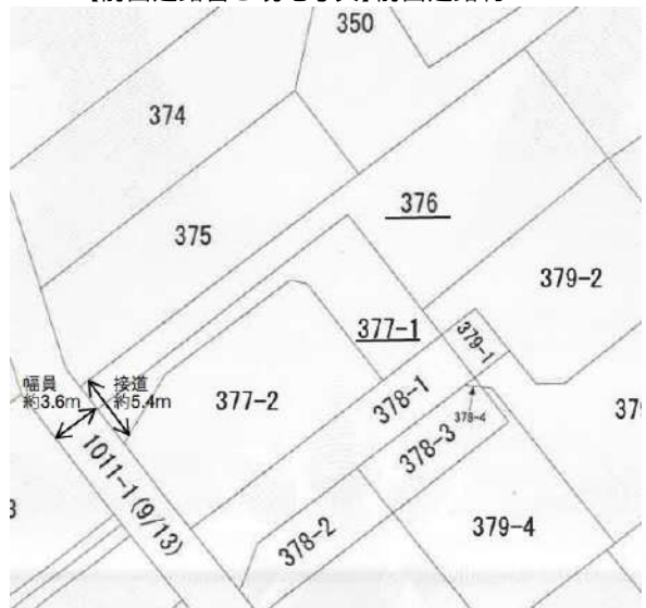
【区画図】接道約5.4m 隅切りがあり車も入りやすいです