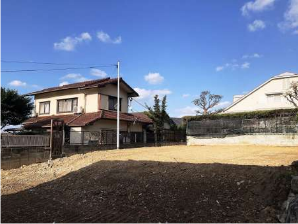
【現況写真】敷地約108坪