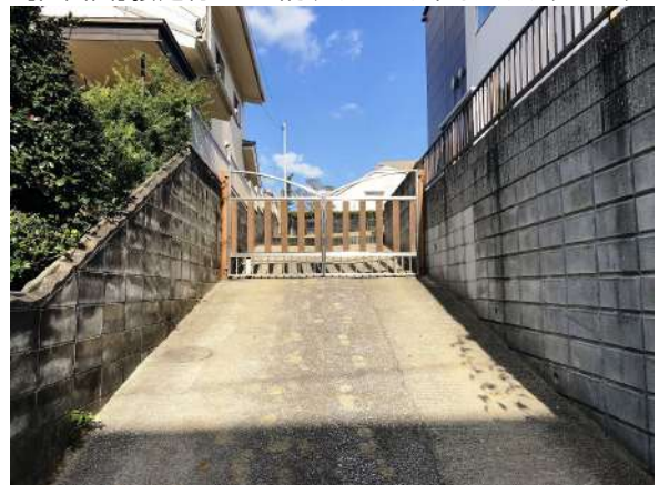
【現況写真】敷地進入路