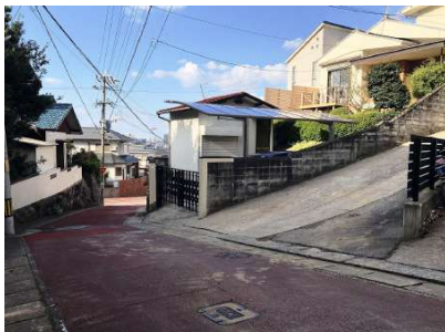
【前面道路含む現地写真】前面道路約3.6m