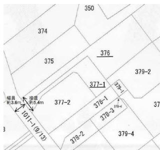
【区画図】接道約5.4m 隅切りがあり車も入りやすいです