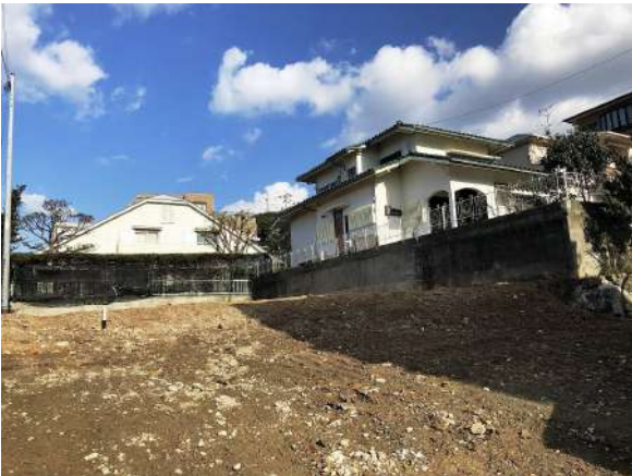
【現況写真】敷地約108坪