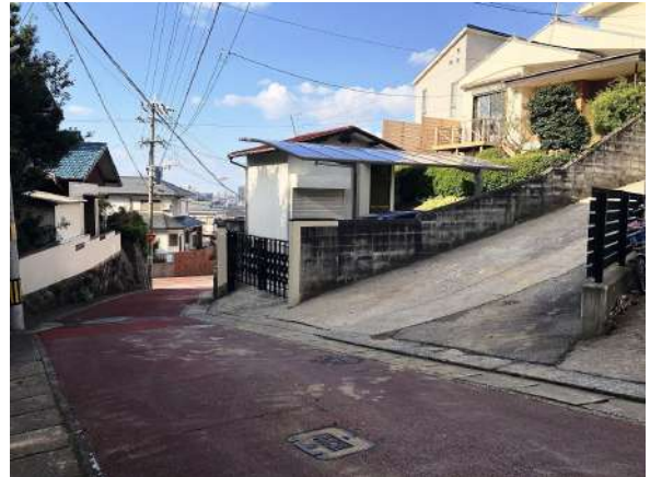
【前面道路含む現地写真】前面道路約3.6m