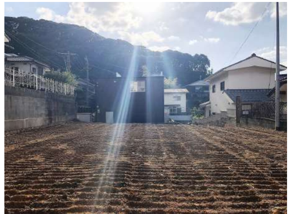
【現況写真】敷地約108坪