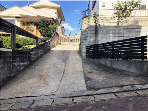
【現況写真】接道約5.4m 隅切りがあり車も入りやすいです