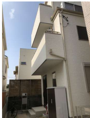
【現況外観写真】現地(2019年10月)撮影