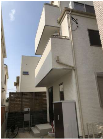
【現況外観写真】現地(2019年10月)撮影