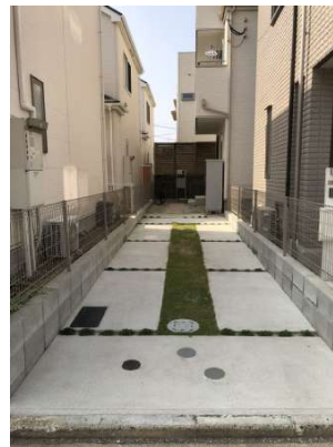
【外観写真】現地(2019年10月)撮影 駐車スペース2台分(縦列駐車)。