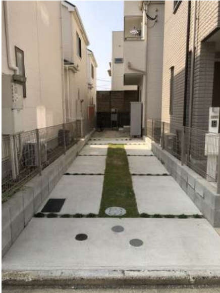
【外観写真】現地(2019年10月)撮影 駐車スペース2台分(縦列駐車)。