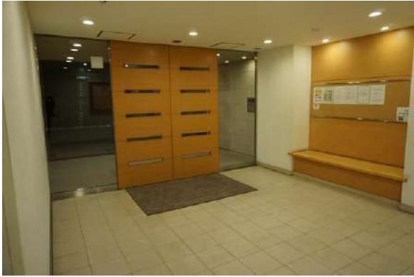
【エントランスホール】エントランス