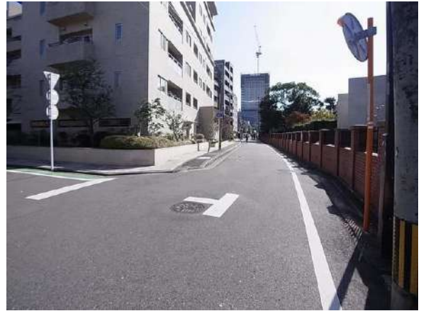
【その他】前面道路含む現地写真