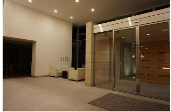
【エントランスホール】エントランス