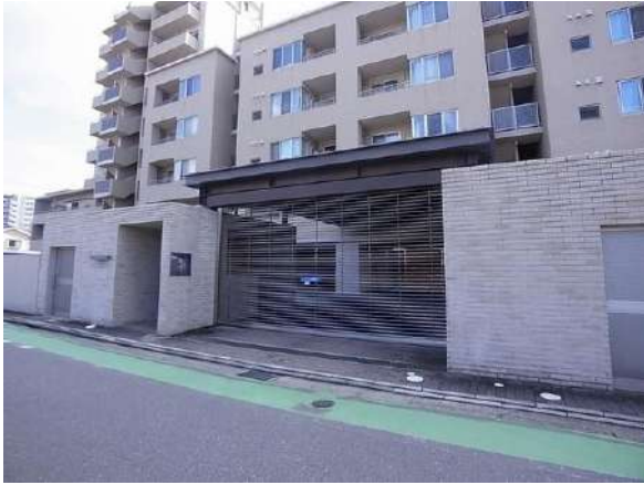
【外観写真】外観写真