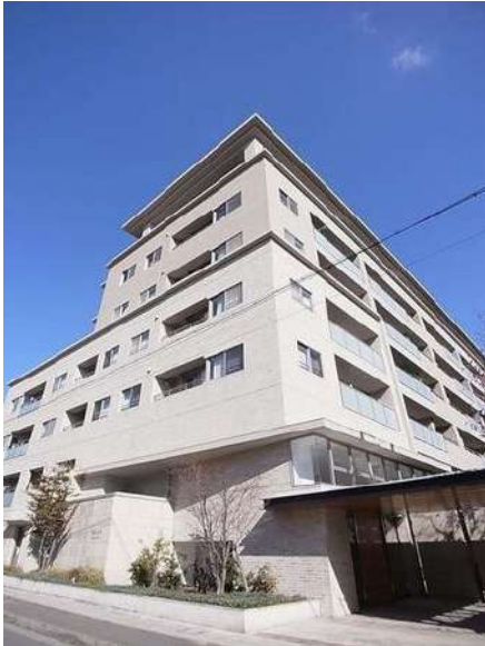
【外観写真】外観写真