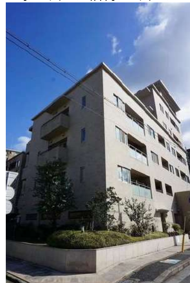
【外観写真】外観写真