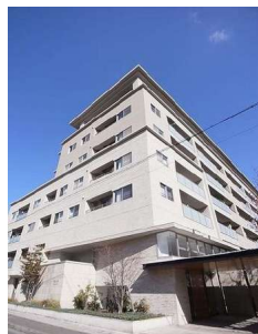
【外観写真】外観写真