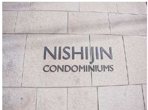
【その他】エンブレム