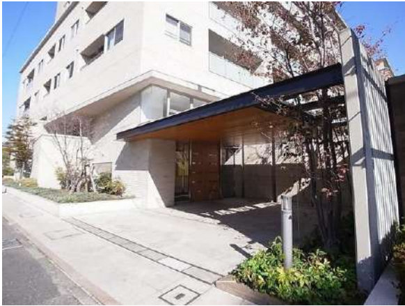
【外観写真】外観写真