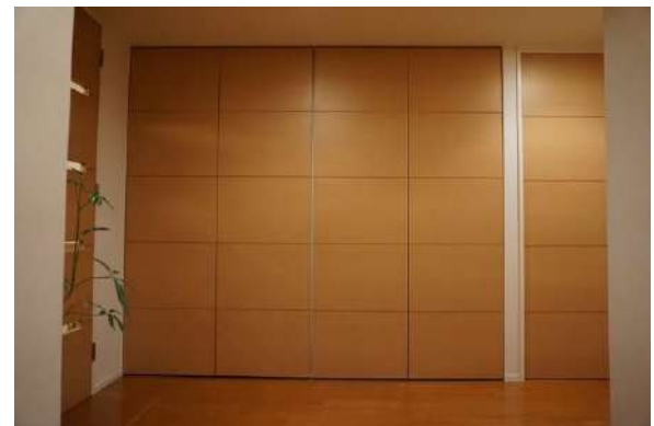
【収納】廊下収納・コートクローク