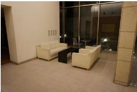
【エントランスホール】エントランス