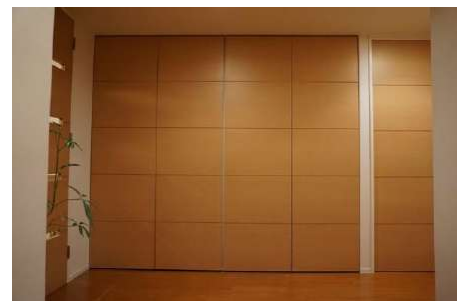
【収納】廊下収納・コートクローク