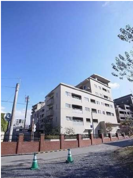
【外観写真】外観写真