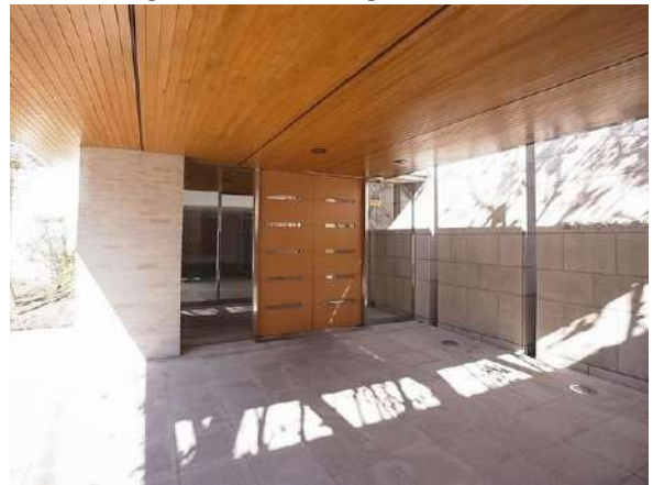
【エントランス(外)】エントランス