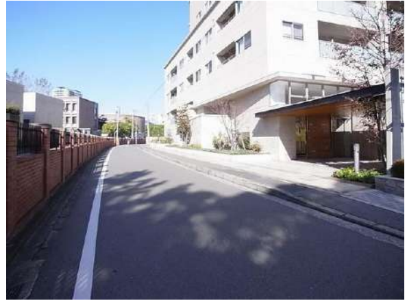
【その他】前面道路含む現地写真