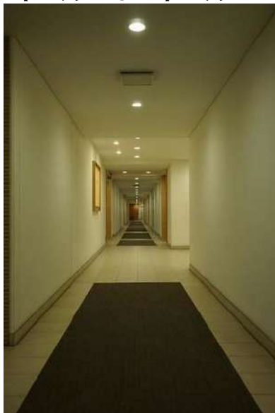
【その他共用部】廊下