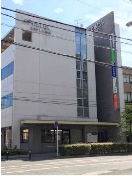
メディカルビル エミナンス平尾