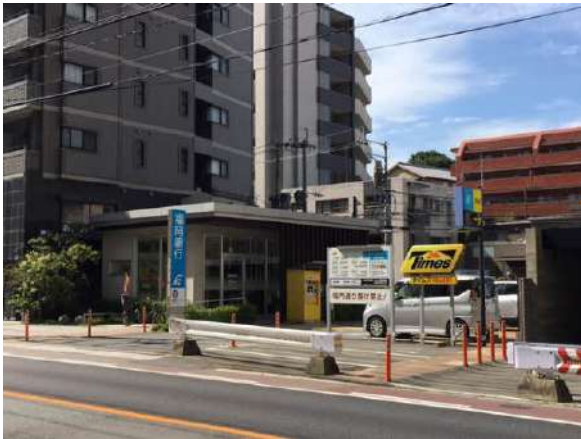
福岡銀行平尾山荘通り出張所