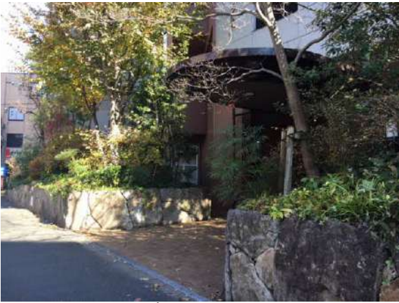
アプローチ部分植栽