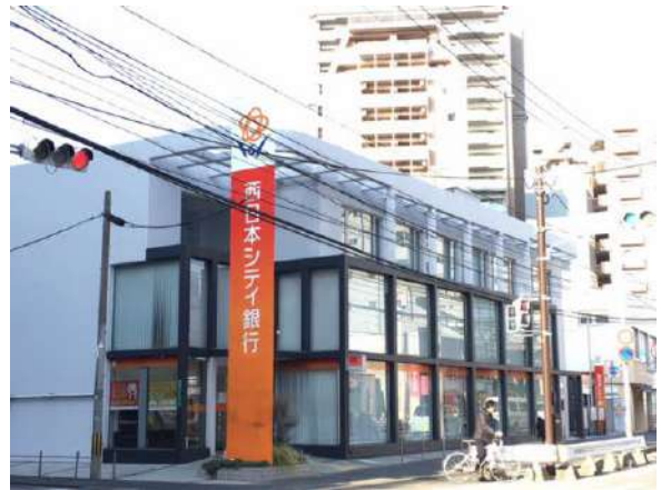
福岡中央銀行平尾支店