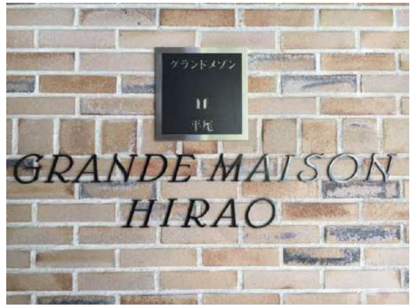
マンションサイン