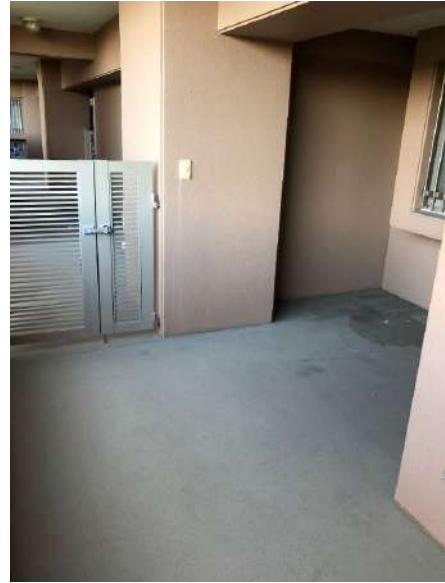
【玄関】玄関前のポーチはベビーカーや自転車も置ける広々スペース