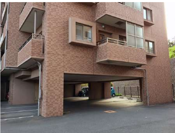
【外観写真】お部屋は2階、階下は駐車場です