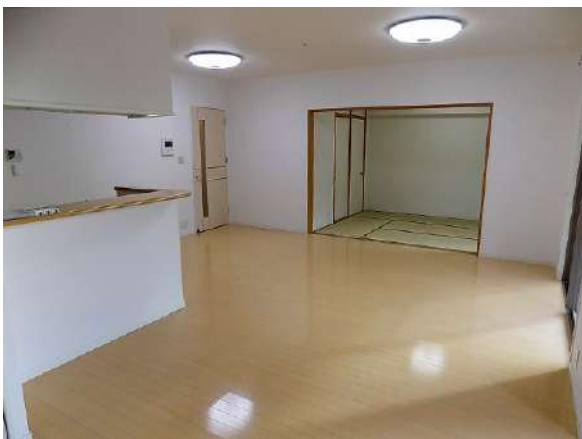
【リビングダイニング】広々リビングダイニング