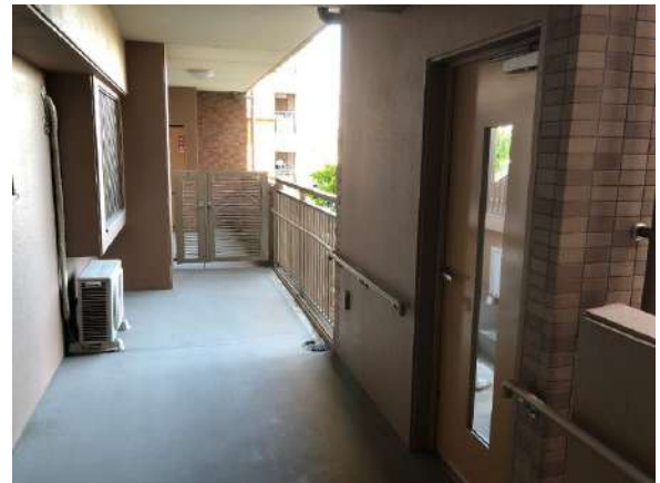
【その他共用部】お部屋のそばには駐車場にすぐ行ける階段の出入口があります