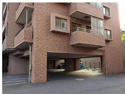
【外観写真】お部屋は2階、階下は駐車場です