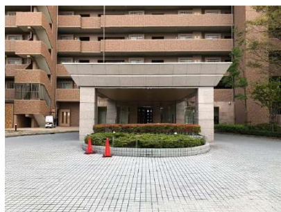
【エントランス(外)]ホテルの入口のようなエントランス入口