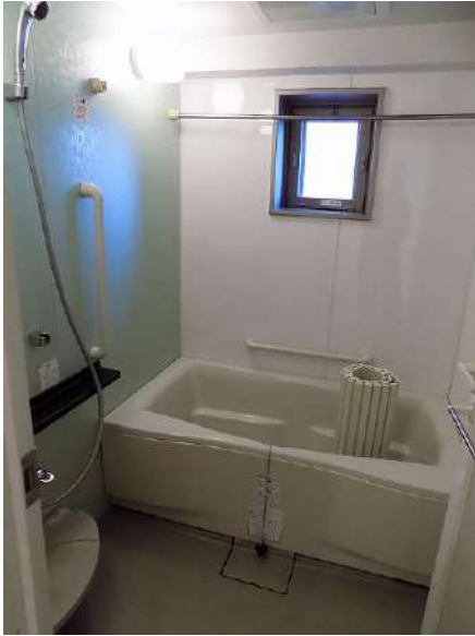
【浴室】小窓と浴室乾燥機の付いた浴室