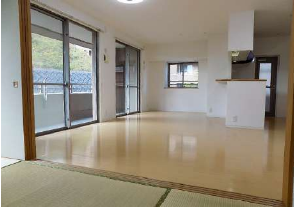
【リビングダイニング】4LDKを3LDKに変更しました