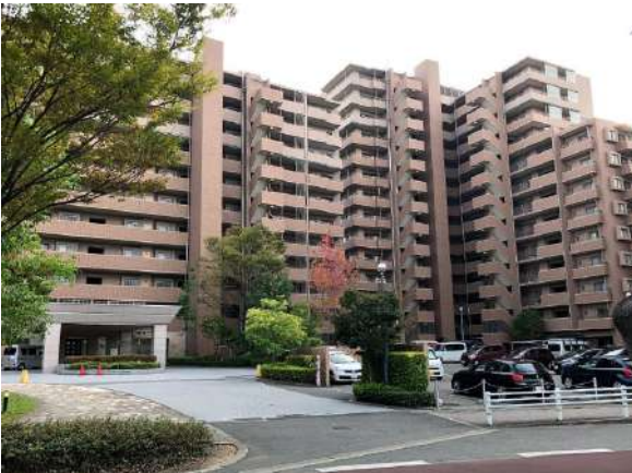
【外観写真】南区屈指の大型マンション・레이크ヒルズ野多目6番館