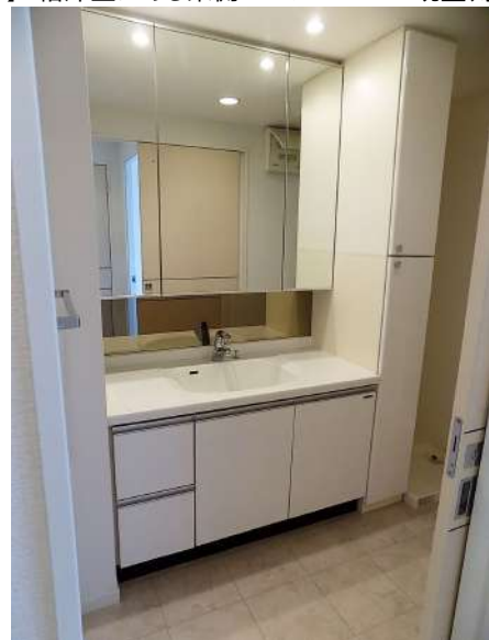
【洗面化粧台】大きな鏡と棚の付いた洗面所