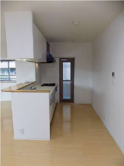
【キッチン】キッチンには勝手口が付いています