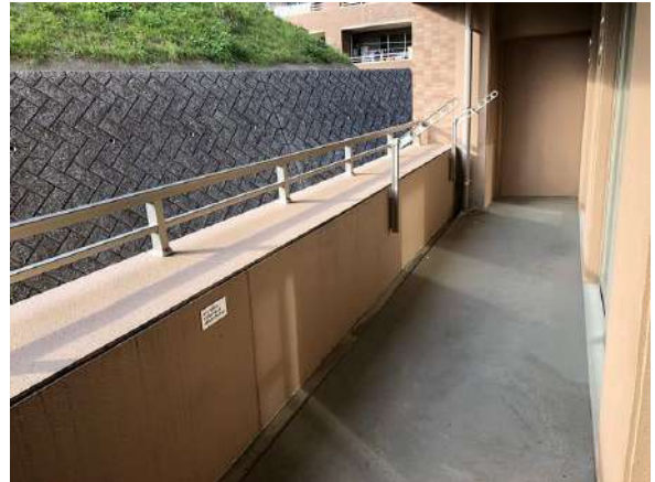
【バルコニー】西側の余裕あるメインバルコニー