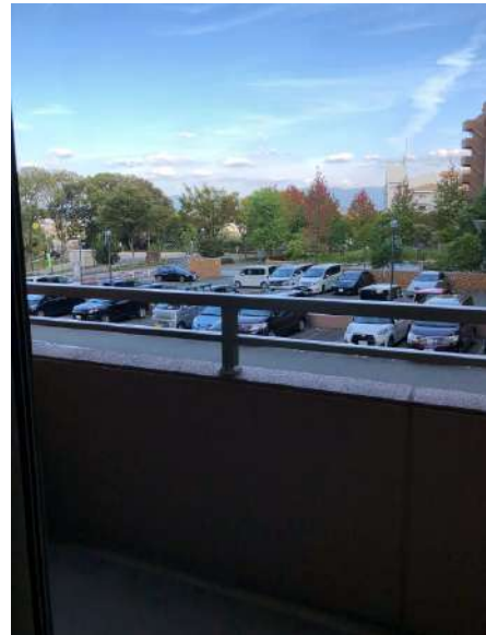
【バルコニー】6帖洋室にある東側のバルコニーの眺望、駐車場側です