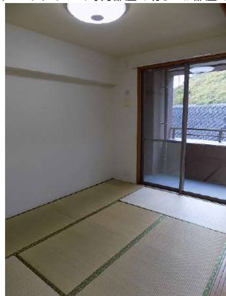
【和室】ごろりと横になれる和室もうれしいですよ