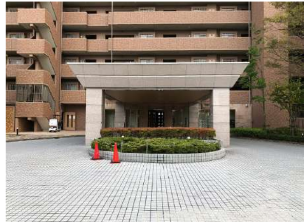
【エントランス(外)】ホテルの入口のようなエントランス入口