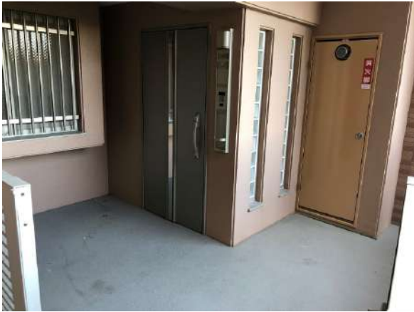
【玄関】専用ポーチの付いたお部屋の玄関