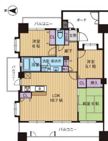
【間取り図】4LDKを3LDKに変更、三面バルコニーの角部屋