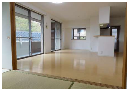
【リビングダイニング】4LDKを3LDKに変更しました