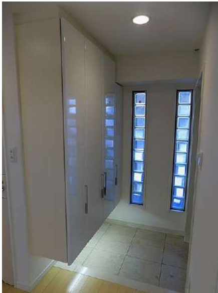
【玄関】玄関収納もたっぷりです