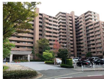
【外観写真】南区屈指の大型マンション・レークヒルズ野多目6番館