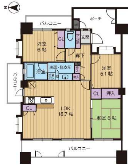
【間取り図】4LDKを3LDKに変更、三面バルコニーの角部屋