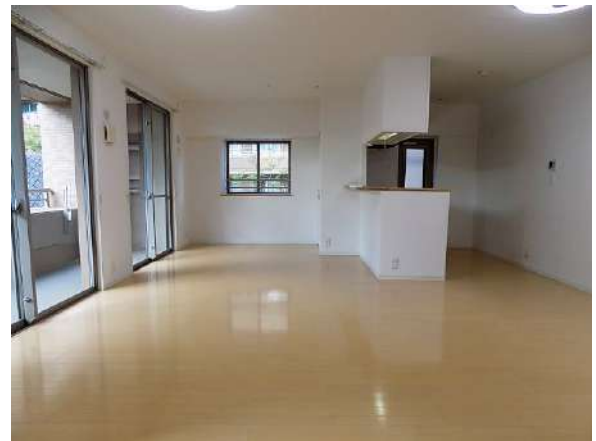
【リビングダイニング】角部屋で明るいお部屋です