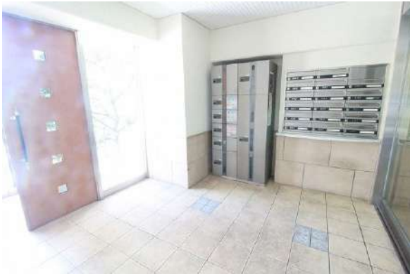
【エントランスホール】