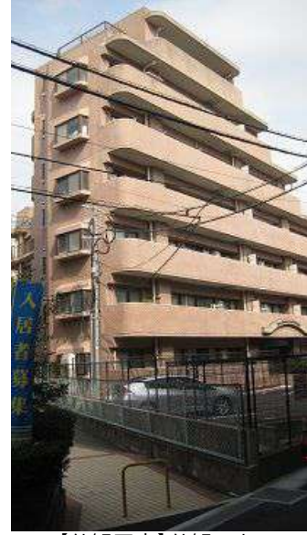
【外観写真】外観です。