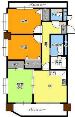
【間取り図】間取りです。