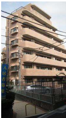
【外観写真】外観です。