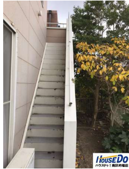
【その他設備】裏階段