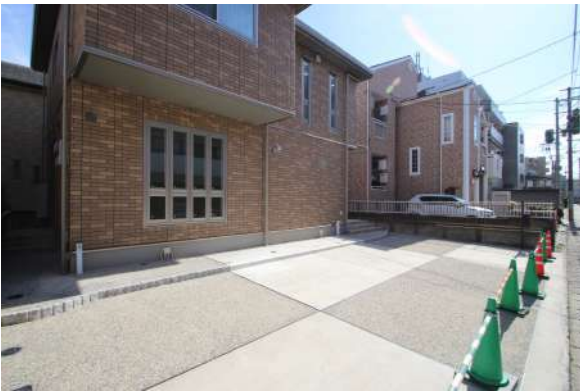
【現況外観写真】前面駐車場スペースも広く4台ほど駐車可能です。