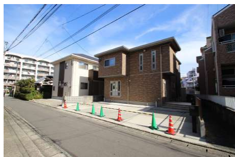
【現況外観写真】平成30年11月完成後、未入居物件となります。