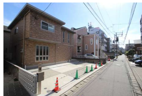
【前面道路含む現地写真】前面道路の様子です。