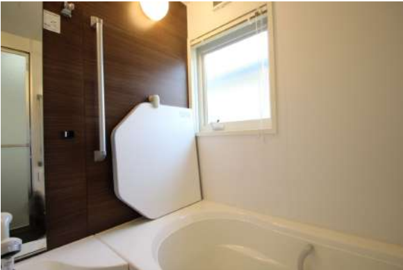
【浴室】落ち着いた雰囲気でお癒されるバスルーム