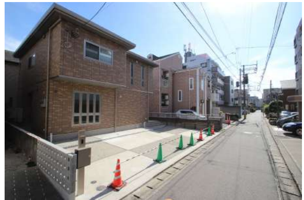
【前面道路含む現地写真】前面道路の様子です。