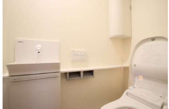
【トイレ】2階トイレはタンクレスに手洗い付き