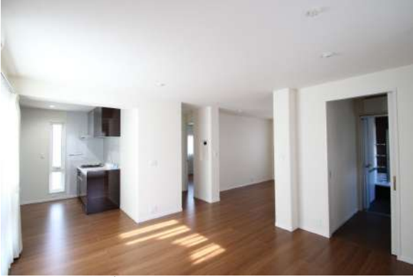
【ダイニングキッチン】明るい室内