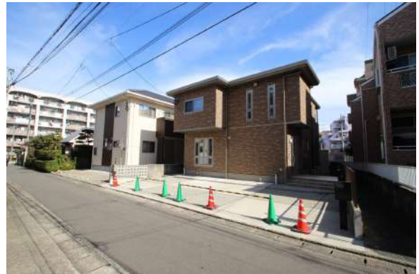
【現況外観写真】平成30年11月完成後、未入居物件となります。