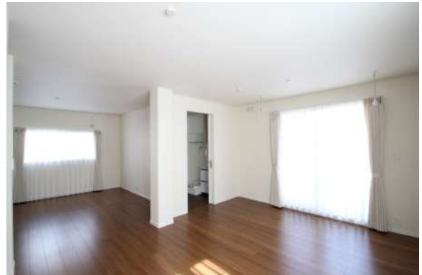
【リビングダイニング】広々ダイニングリビングは、明るく風通しの良い部屋です