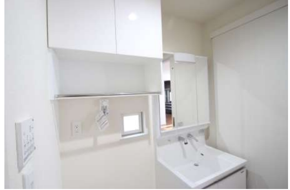
【洗面化粧台】2階サニタリールームは清潔感ある白を基調としております。