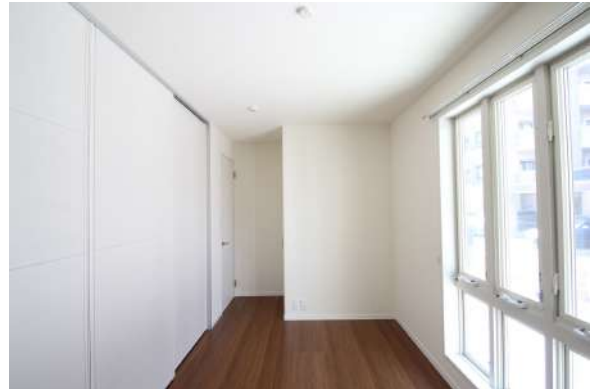
【洋室】1階西側の洋室は壁面に収納を豊富に揃えております。