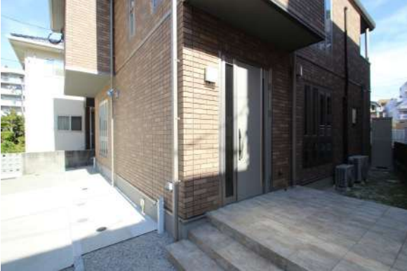
【現況外観写真】2階に続く玄関は電子施錠も可能となっております。