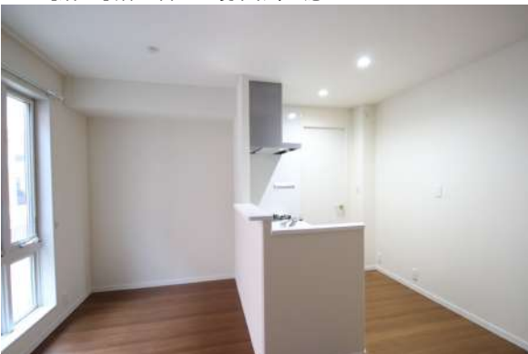
【ダイニングキッチン】1階ダイニングキッチン