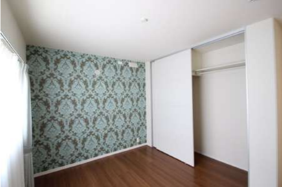
【洋室】2階北西側の洋室は、豊富な収納を備えております。