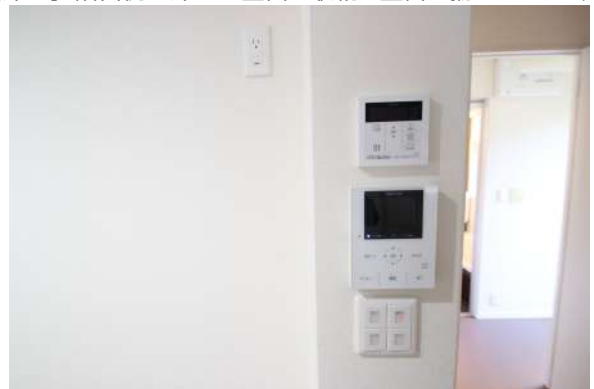
【その他設備】各種設備も充実しております。