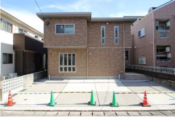
【外観写真】セキスイハイム施工の新築後未入居物件です。