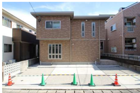
【外観写真】セキスイハイム施工の新築後未入居物件です。