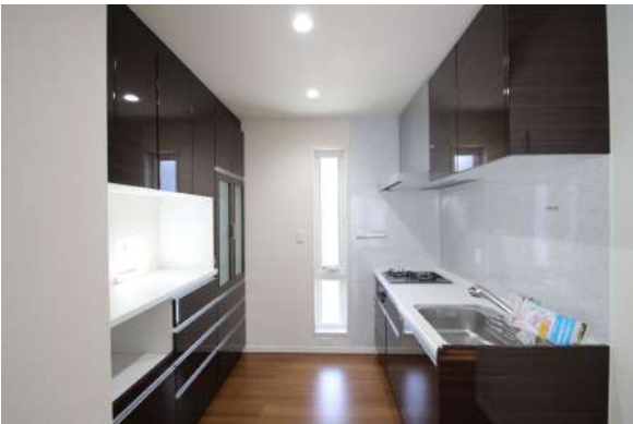
【キッチン】2階キッチンは収納も豊富なタカラキッチン