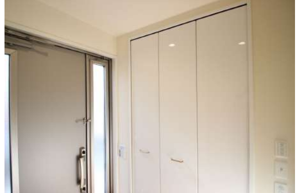
【収納】2階に繋がる玄関ホール内は、来客用にも収納が豊富です。