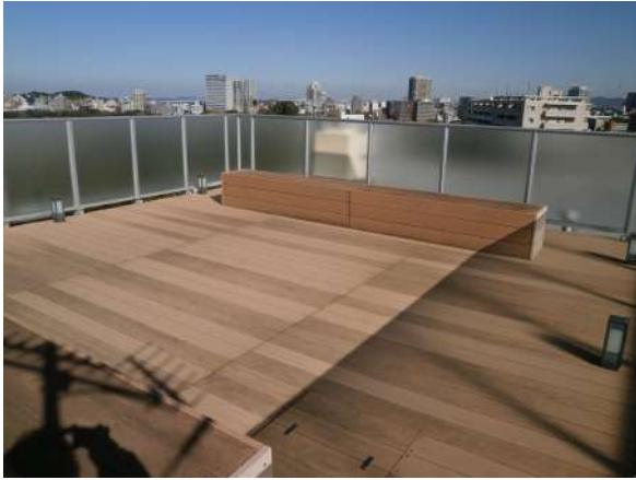
【その他共用部】スカイテラス