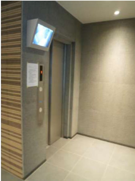
【その他共用部】エレベーター