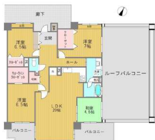
【間取り図】約50㎡のルーフバルコニー!