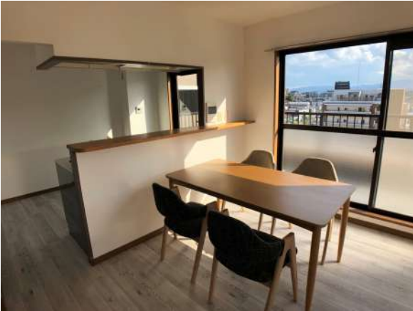
【ダイニングキッチン】キッチンにはカウンターが付いています