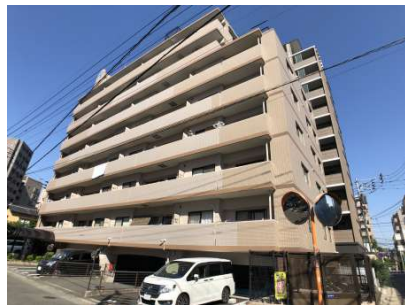
【外観写真】西鉄高宮駅徒歩9分のリフォーム済物【間取り図】件です!