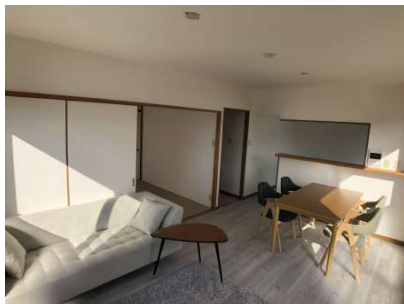
【リビングダイニング】日当たりの良いLDK