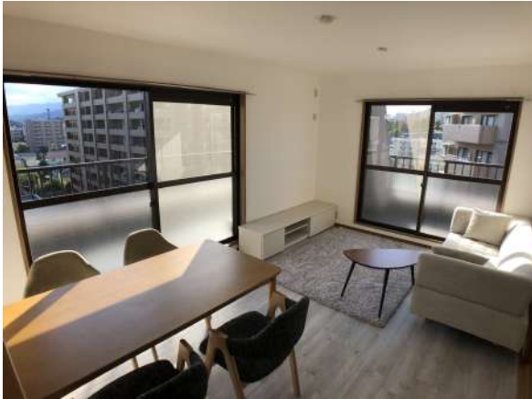
【リビングダイニング】日当たりの良いLDK