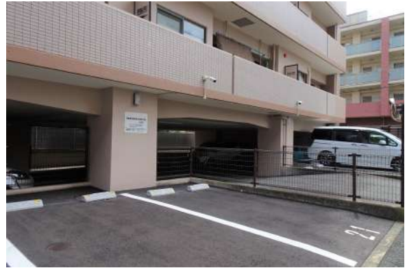
【駐車場】敷地内駐車場