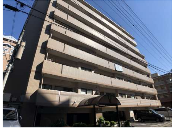
【外観写真】外観写真