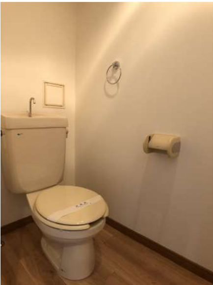
【トイレ】トイレはクリーニング済みです