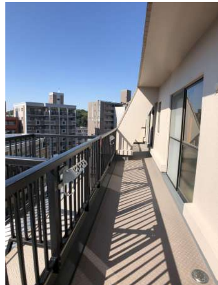
【バルコニー】西側バルコニー