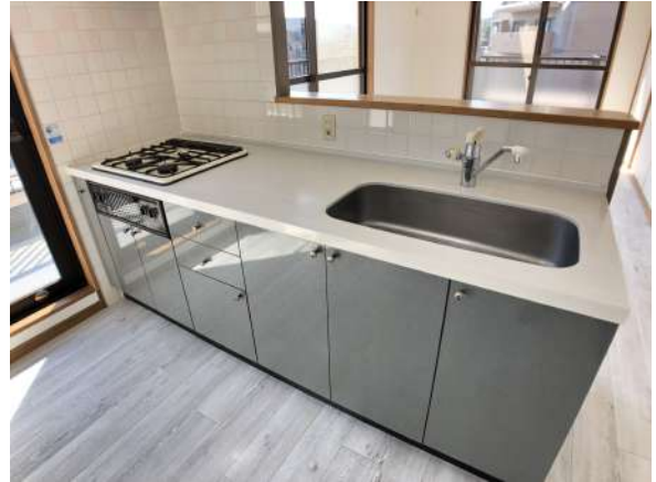
【キッチン】手元を隠せる対面式システムキッチン