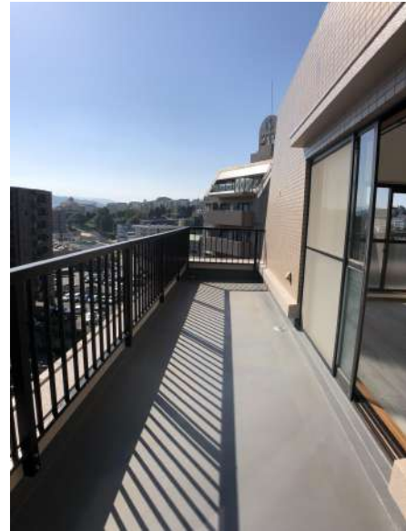
【バルコニー】南側ルーフバルコニー