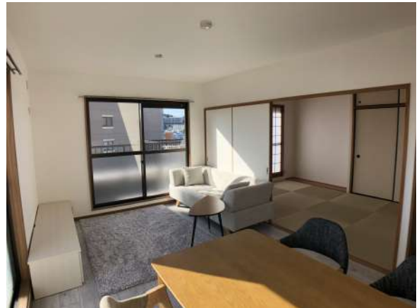
【リビングダイニング】リビングダイニング 和室