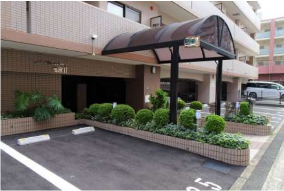
【エントランス(外)]アプローチ