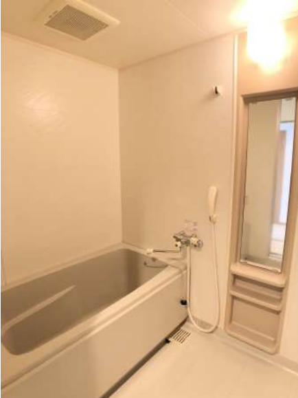
【浴室】掃除のしやすいユニットバス