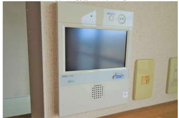
【防犯設備】TVモニタ付きインターホン