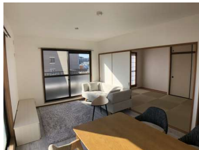
【リビングダイニング】リビングダイニング 和室