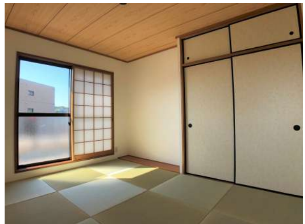
【和室】リビング続きの約6.0帖の和室