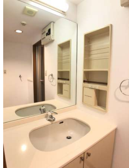
【洗面化粧台】大きな鏡付きの洗面化粧台