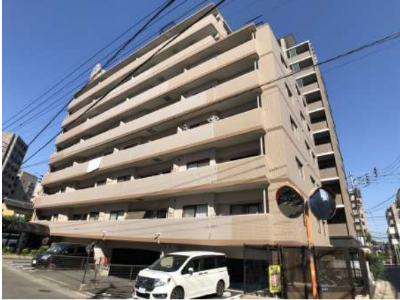
【外観写真】西鉄高宮駅徒歩9分のリフォーム済物件です！