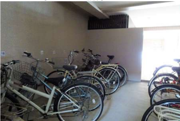
【駐輪場】敷地内駐輪場