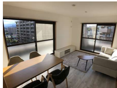
【リビングダイニング】日当たりの良いLDK