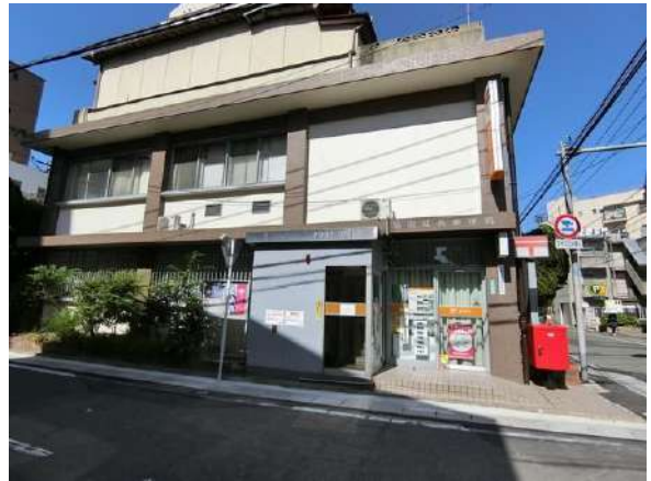
【その他】城西郵便局(約320m)