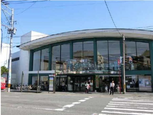
【その他】レガネット城西(約450m)