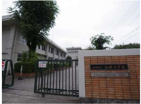
【その他】西新小学校(約1220m)