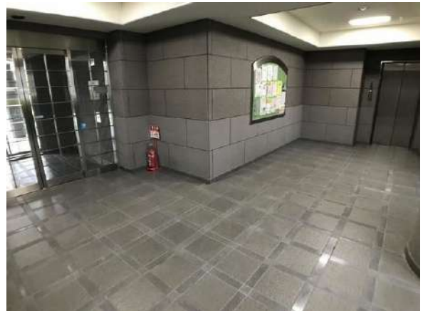
【エントランスホール】