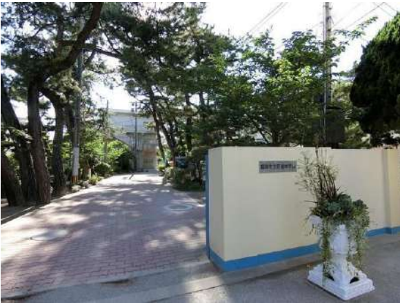
【その他】百道中学校(約2200m)