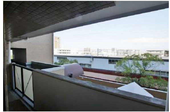
【眺望】高宮駅目の前です