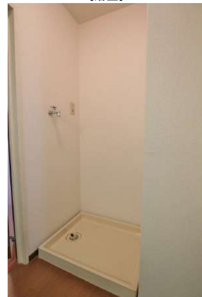
【ランドリースペース】