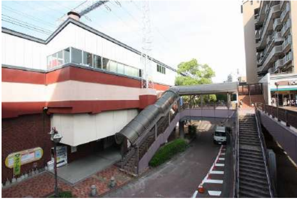
【現況写真】高宮駅と直結しております