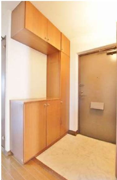
【収納】シューズボックス