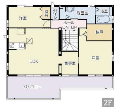
【間取り図】3階建て商品「デシオ」安心の軽量鉄骨造です