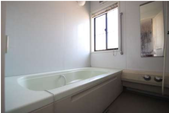
【浴室】2階のバスルーム