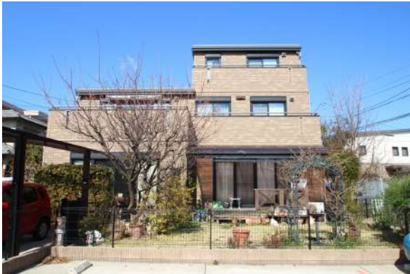
【外観写真】価格改定。セキスイハイム施工の3階建