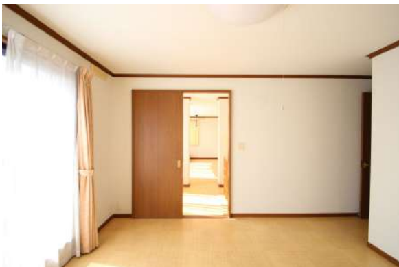
【洋室】三方を道路に囲まれております