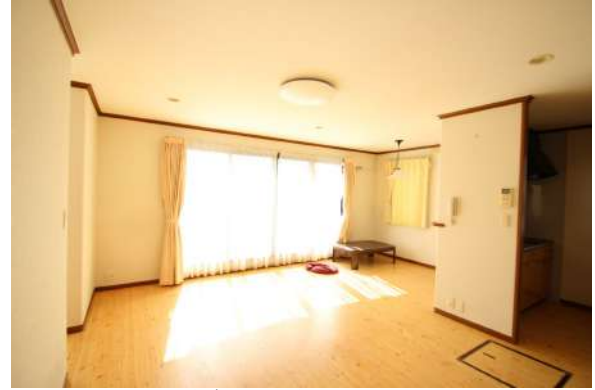
【リビングダイニング】2階のLDKの様子