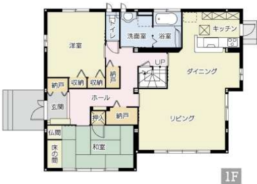
【間取り図】価格を見直しました。セキスイハイム施工物件