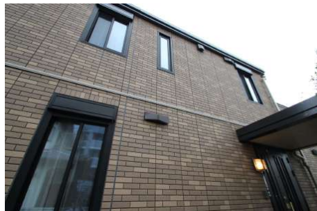
【外観写真】屋根塗装完了しました。(2019年9月)