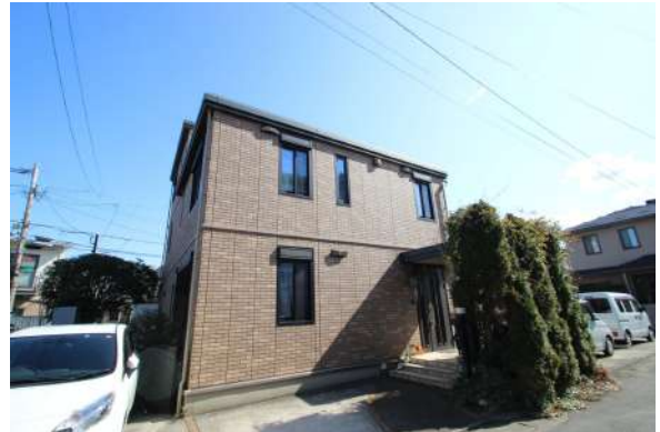
【外観写真】タイル外壁がいつまでも美しい外観を維持します