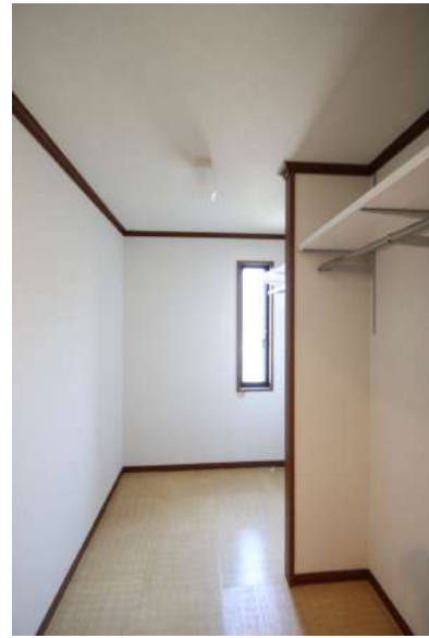
【ウォークインクローゼット】2階寝室のウォークインクローゼット