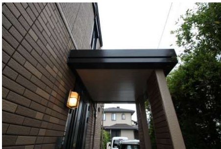
【外観写真】ポーチその他外装塗装完了しました。(2019年9月)