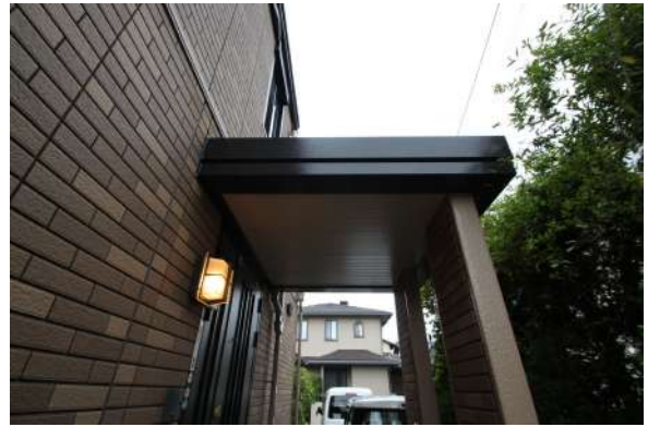
【外観写真】ポーチその他外装塗装完了しました。(2019年9月)