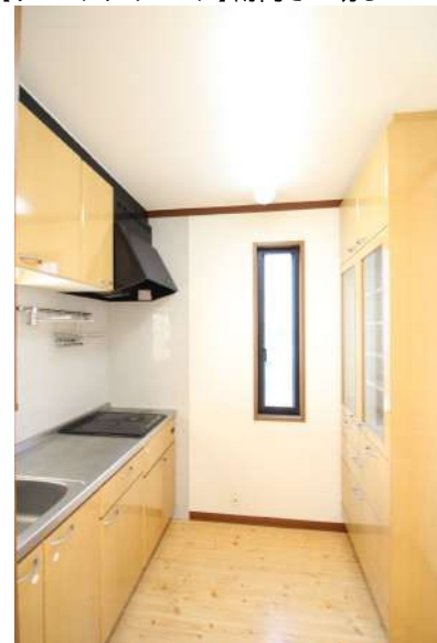
【キッチン】2階のキッチン