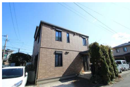
【外観写真】タイル外壁がいつまでも美しい外観を維持します