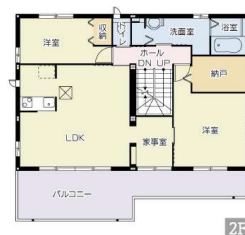
【間取り図】3階建て商品「デシオ」安心の軽量鉄骨造です