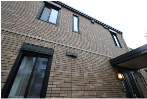
【外観写真】屋根塗装完了しました。(2019年9月)