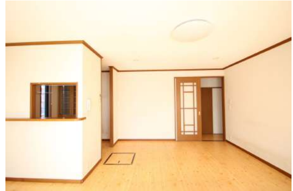
【リビングダイニング】南向きの明るいLDK