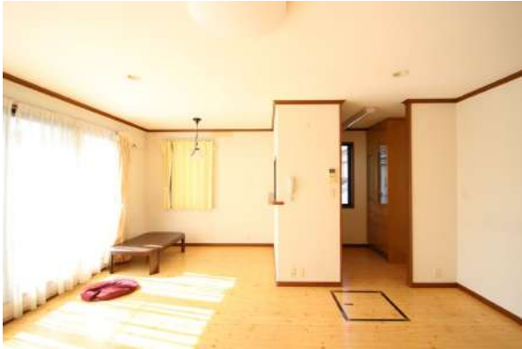
【リビングダイニング】ペットに優しいフローリングを採用しております