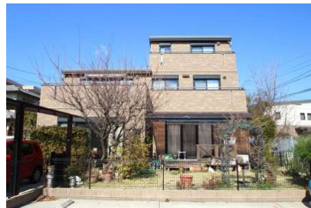
【外観写真】価格改定。セキスイハイム施工の3階建て