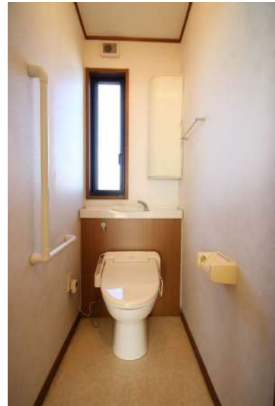
【トイレ】2階のトイレ