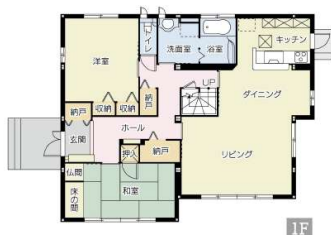
【間取り図】価格を見直しました。セキスイハイム施工物件