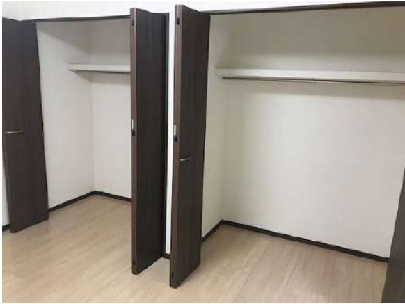
【収納】クローゼット