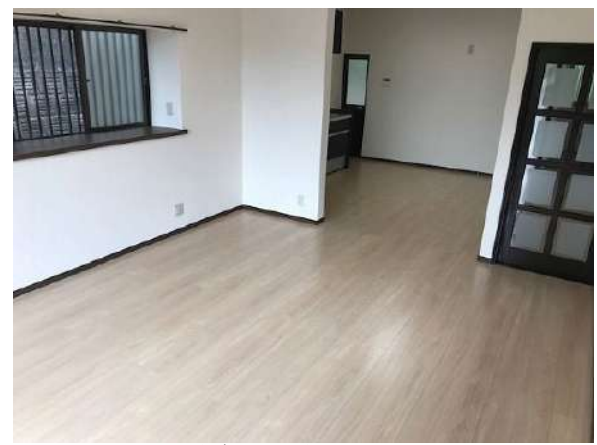
【リビングダイニング】LDK(約17.3帖)