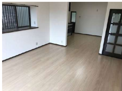
【リビングダイニング】LDK(約17.3帖)