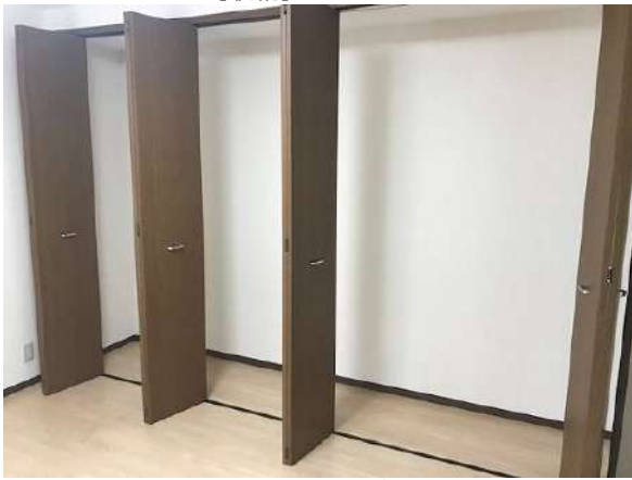
【収納】クローゼット