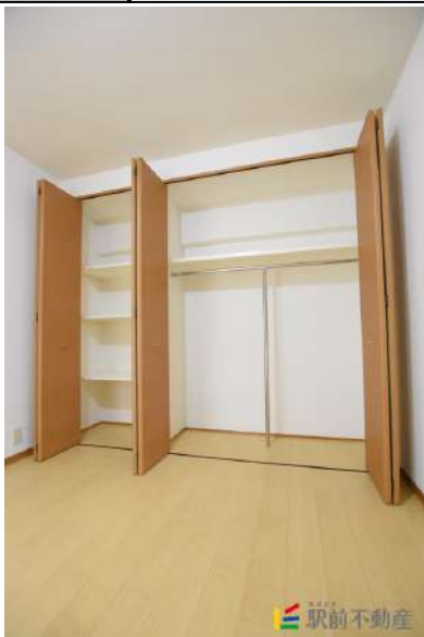
各収納も豊富です!