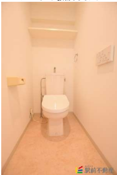
ウォシュレット完備