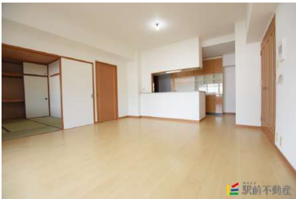
フローリング張替しました!