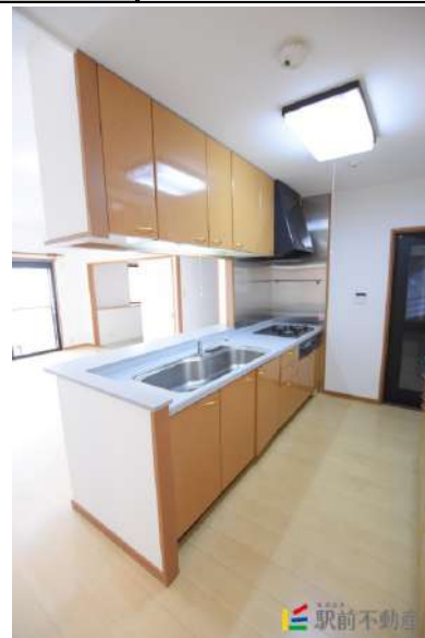
ガスコンロ新品!都市ガスです!