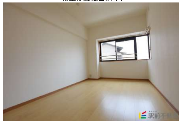
南側洋室6.5帖あります!