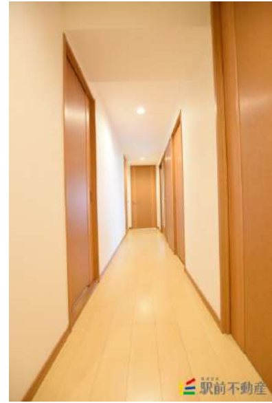
開放感のある通路!