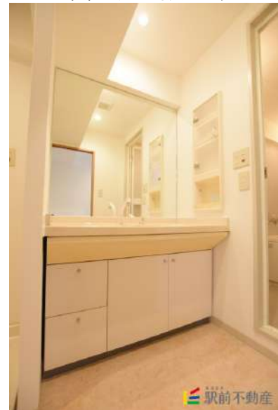
鏡とシャワー新品にしました!