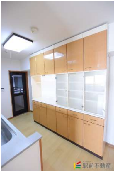
カップボード設置!!