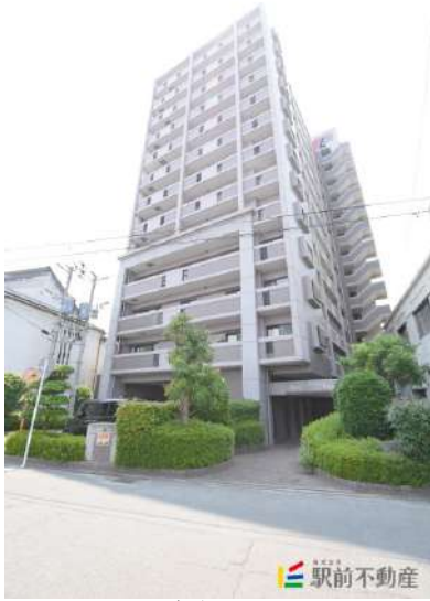
西鉄・JRダブルアクセス可能