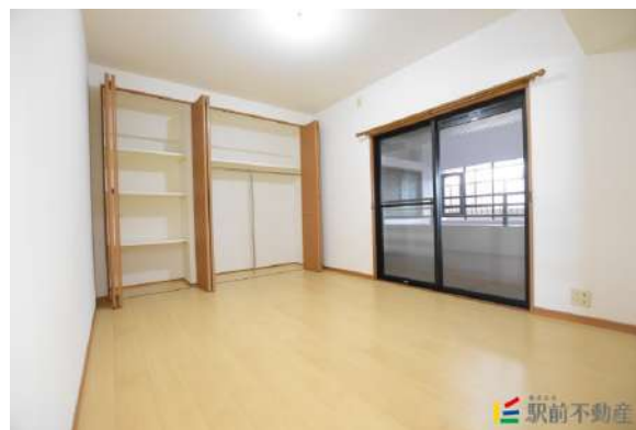
和室は畳張替済み!