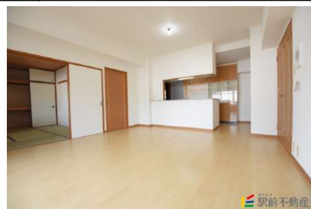
フローリング張替しました!