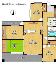
95平米ありとても広いです!!