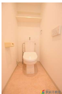
ウォシュレット完備