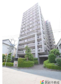
西鉄・JRダブルアクセス可能