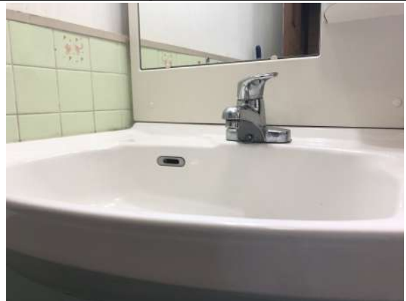
平成27年7月頃洗面台交換済み!