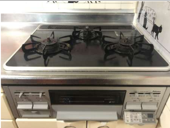
平成27年7月頃ガスコンロ交換済み!