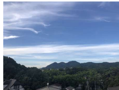
2Fからの眺望です。視界を遮るものがなく眺望良好です。