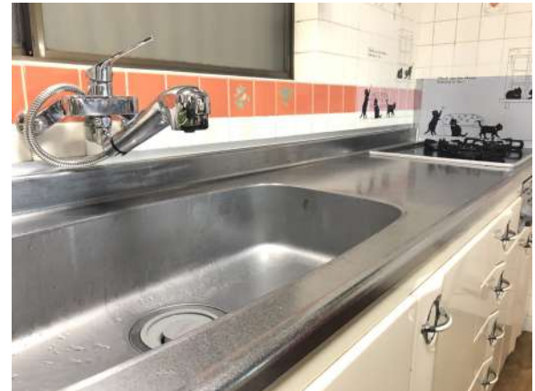
窓付のキッチンです。