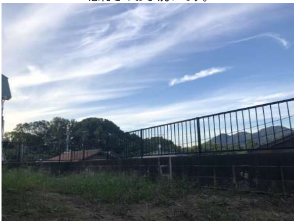
広々とした庭付きで開放的です。