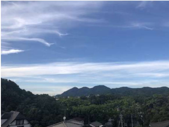
2Fからの眺望です。視界を遮るものがなく眺望良好です。