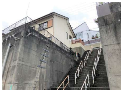
高低差のある立地ですが、その分見晴らしの良い 大きな窓のある明るいリビングです。土地です。