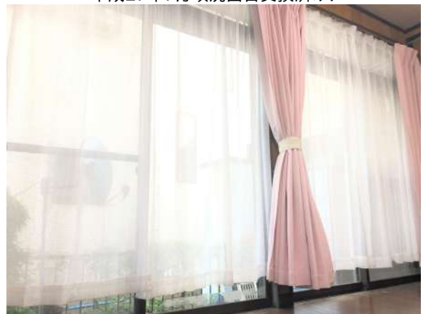
リビング横の洋室写真です。大きな窓があり開放的です。