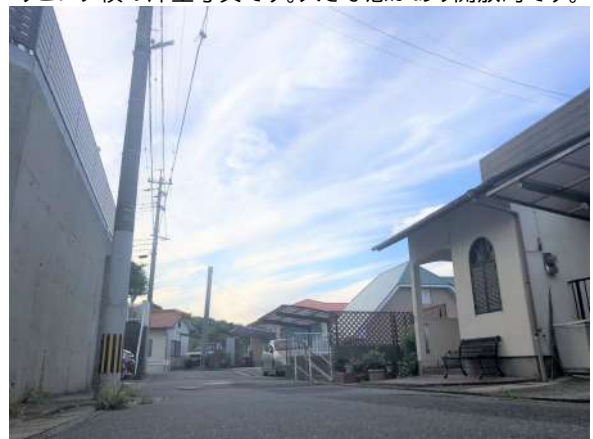
前面道路南側より撮影です。