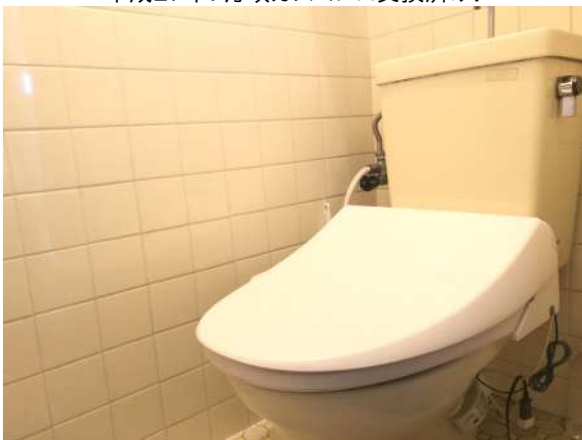
窓付きのお手洗いです。