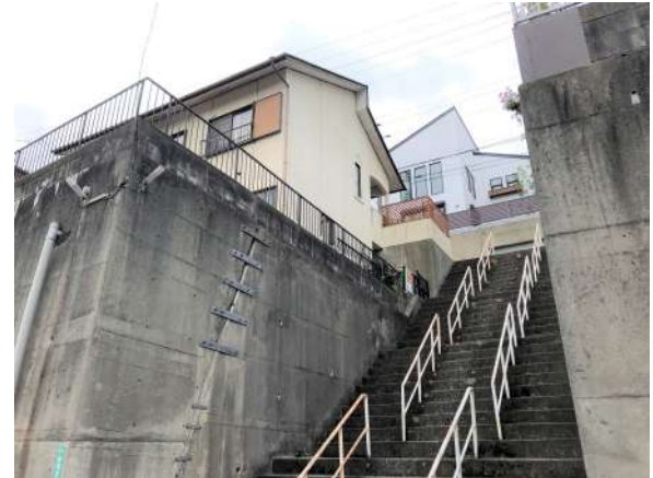
高低差のある立地ですが、その分見晴らしの良い土地です。