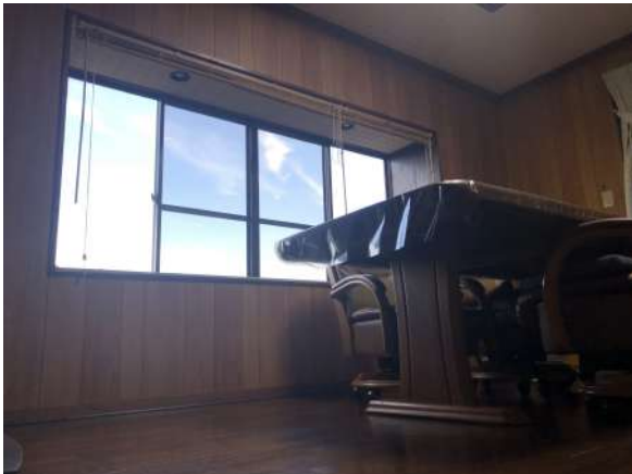
大きな窓のある明るいリビングです。