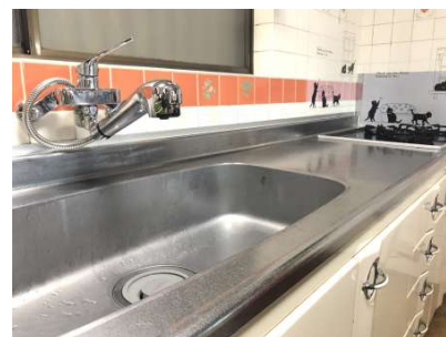
窓付のキッチンです。