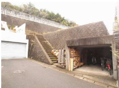
【前面道路含む現地写真】南東道路接道、掘車庫 【現況写真】宅地