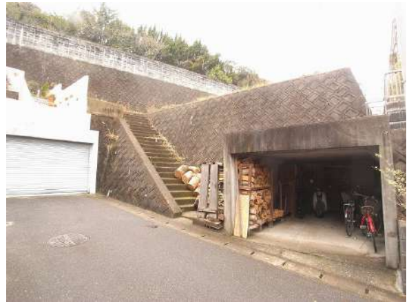
【前面道路含む現地写真】南東道路接道、掘車庫