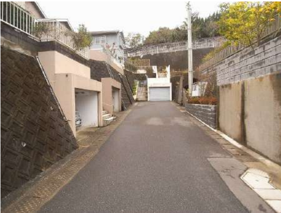
【前面道路含む現地写真】南東道路