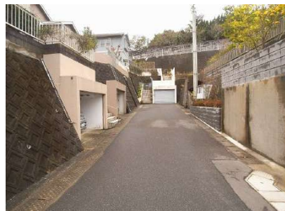
【前面道路含む現地写真】南東道路