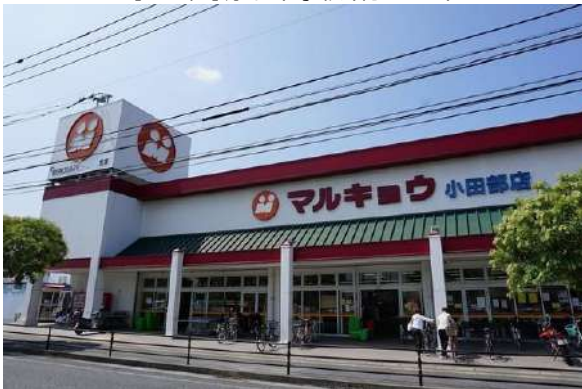
【その他】マルキョウ小田部店(約590m)