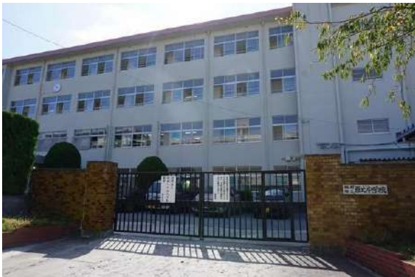
【その他】原北中学校(約540m)