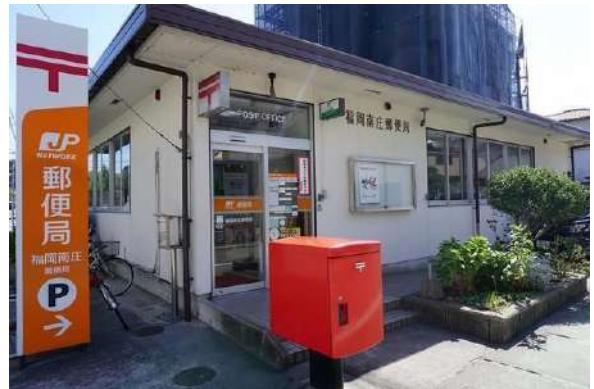
【その他】福岡南庄郵便局(約400m)