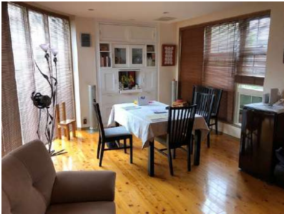
【居間・リビング】リビングルーム約24.3帖