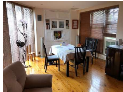
【居間・リビング】リビングルーム約24.3帖