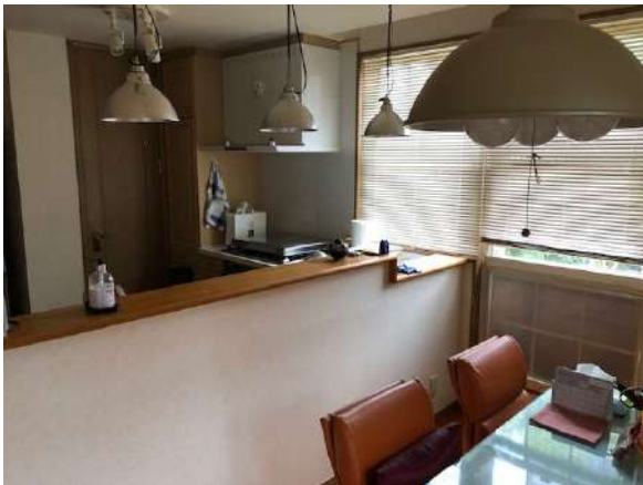
【キッチン】食品庫有