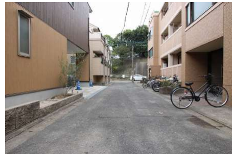
前面道路①(敷地から見た道路)