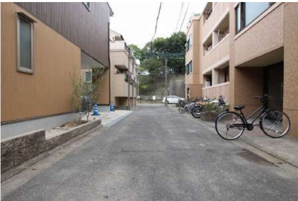
前面道路①(敷地から見た道路)