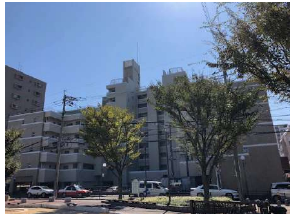
【外観写真】南側公園あり