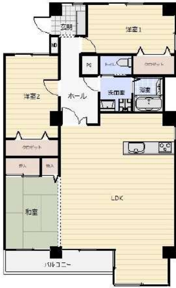
【間取り図】専有面積110.36㎡(壁芯)