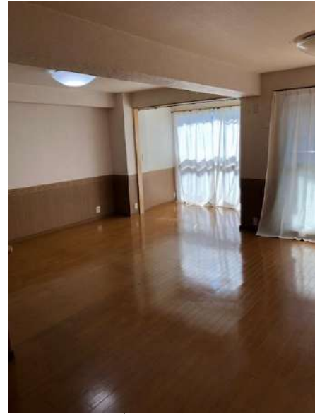
【リビングダイニング】南向き20帖