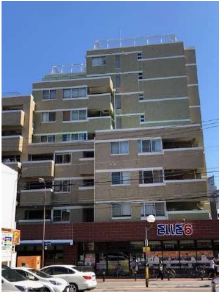
【外観写真】1階スーパーマーケット有り