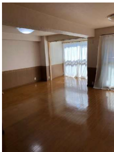
【リビングダイニング】南向き20帖