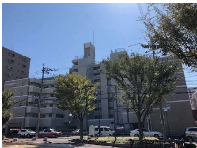
【外観写真】南側公園あり