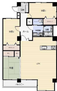
【間取り図】専有面積110.36㎡(壁芯)