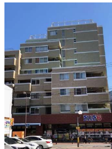
【外観写真】1階スーパーマーケット有り