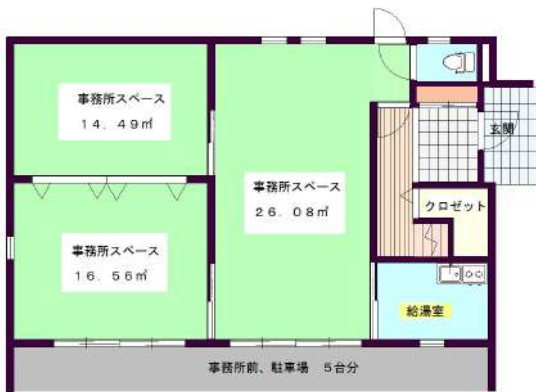
【間取り図】1階:事務所店舗スペース(63.58㎡)