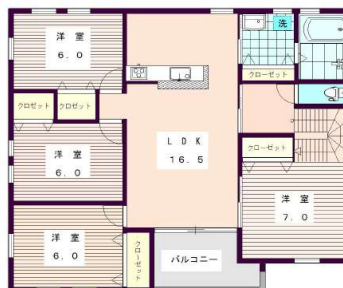
【間取り図】2階:4LDKの広々住居