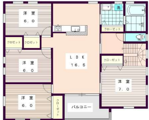
【間取り図】2階:4LDKの広々住居