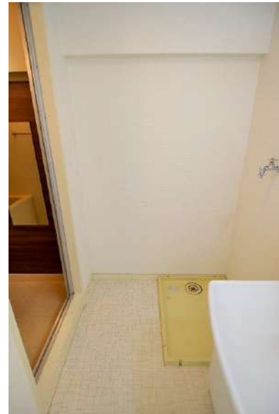
【ランドリースペース】