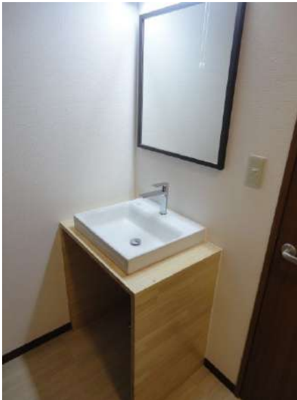
【洗面化粧台】お洒落な洗面化粧台新設しました。