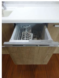
【キッチン】食洗器付きで家事も捗りますね。