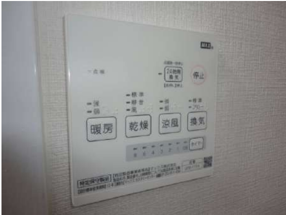
【浴室】浴室冷暖房完備です。