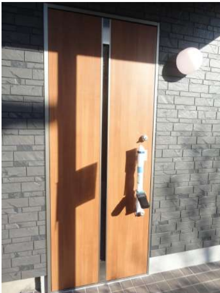
【玄関】玄関扉はリクシル社製の扉に交換しました。