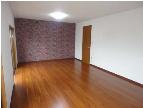
【リビングダイニング】17帖のLDKで広々してます。