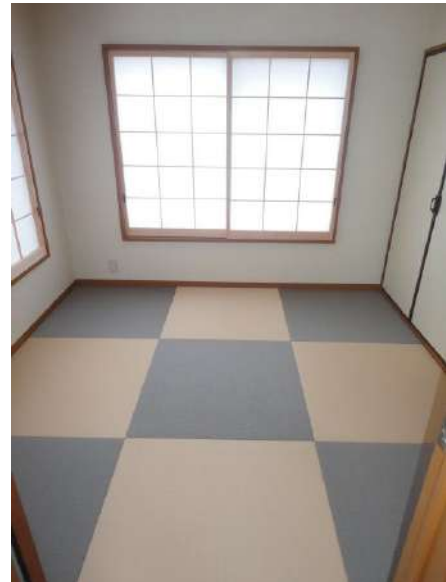
【和室】お洒落な琉球畳を新設しました。