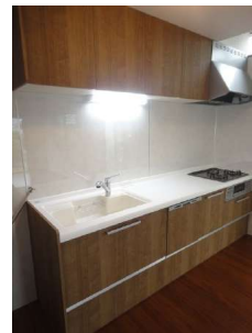
【キッチン】食洗器付きシステムキッチン完備です。