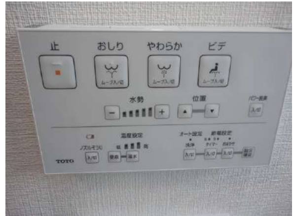
ウォシュレット付きトイレですよ♪