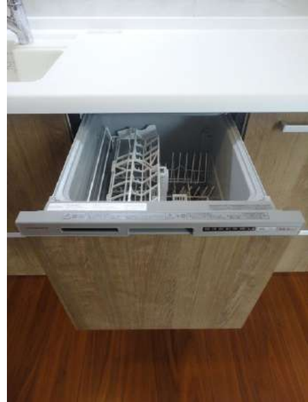
【キッチン】食洗器付きで家事も捗りますね。