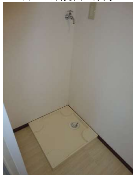
【ランドリースペース】