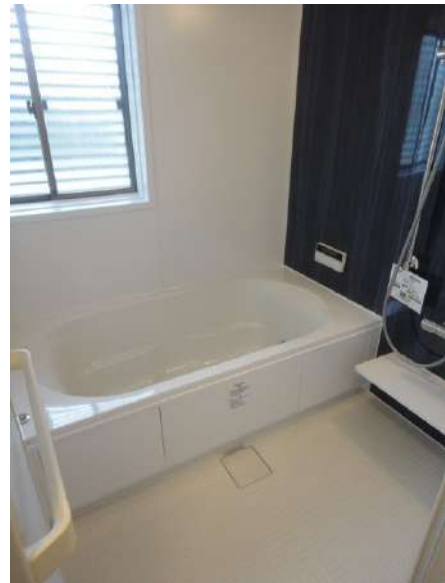
【浴室】1坪タイプのユニットバス完備です。