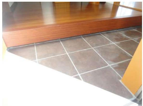
【玄関】玄関タイルも張替ました。