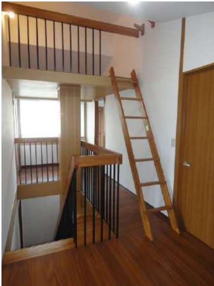
【収納】2階の廊下にはロフトが完備されています。