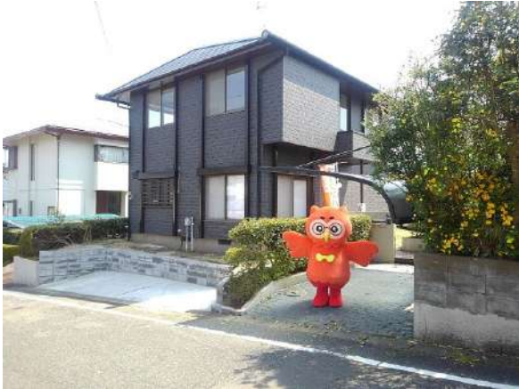
【外観写真】弊社マスコットキャラクター『ホービス君』も一押し物件です！