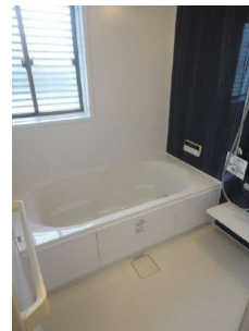
【浴室】1坪タイプのユニットバス完備です。