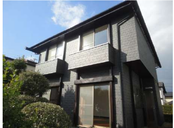
【外観写真】外壁サイディングを張り生まれ変わりました！！