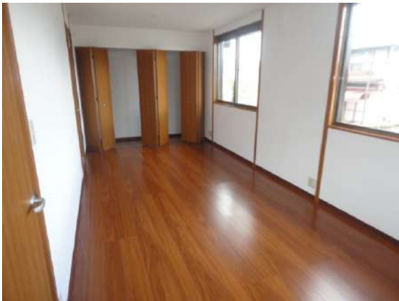
【洋室】2階10帖の洋室です。