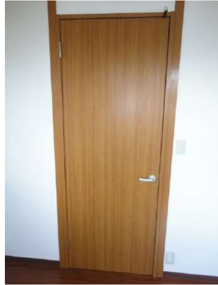
【その他内観】室内建具は全て新品に交換しました。