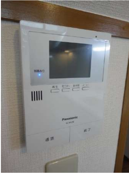
【TVモニタ付きインターフォン】来訪者を確認出来て安心です。