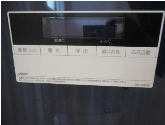
【浴室】追い焚き機能付きです。