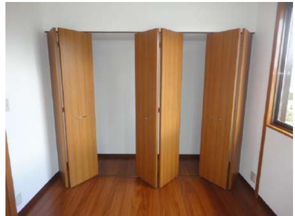
【収納】2階10帖の部屋にはクローゼットを新設しました。