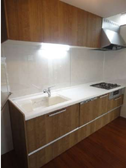
【キッチン】食洗器付きシステムキッチン完備です。