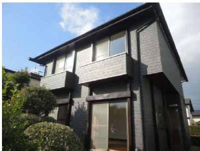
【外観写真】外壁サイディングを張り生まれ変わりました!!