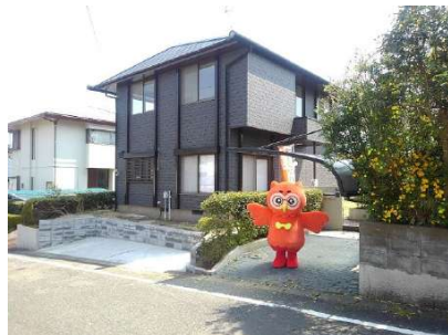
【外観写真】弊社マスコットキャラクター『ホービス君』も一押し物件です!