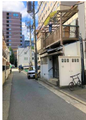
【前面道路含む現地写真】現況写真