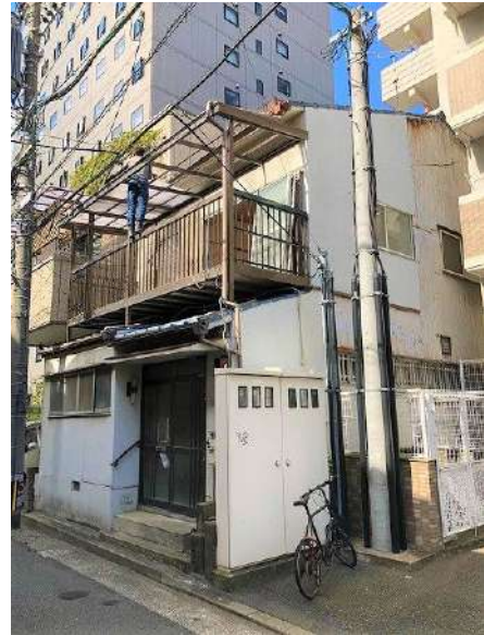
【現況写真】解体更地渡し