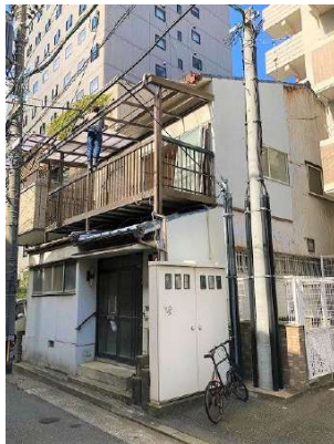
【現況写真】解体更地渡し