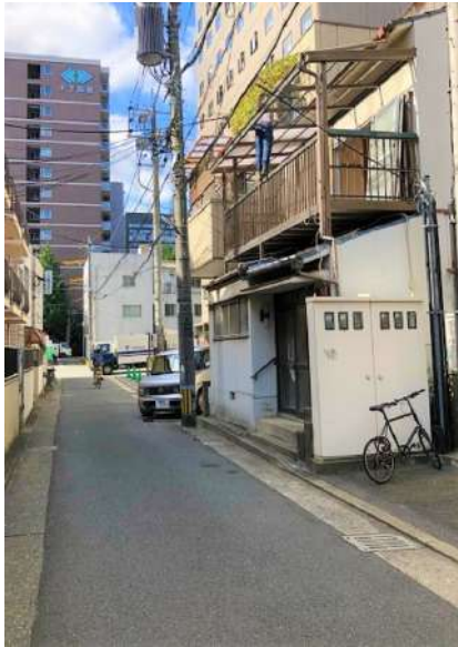
【前面道路含む現地写真】現況写真