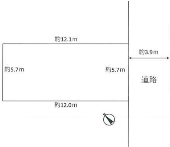
【土地図面】約20坪のフラットな土地