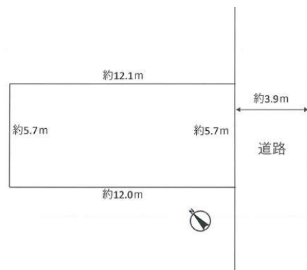
【土地図面】約20坪のフラットな土地