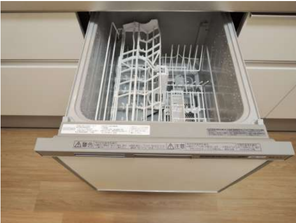
【その他設備】食洗器新調!