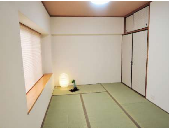
【和室】和室約6帖! プリーツスクリーン付!