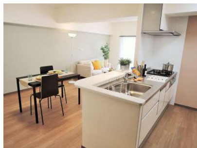
【居間・リビング】3LDK!全室レースカーテン・LED照明、リビングエアコン付