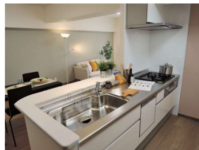
【キッチン】食洗器付システムキッチン新調!