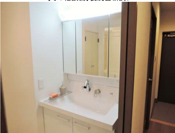
【洗面化粧台】洗面化粧台新調!