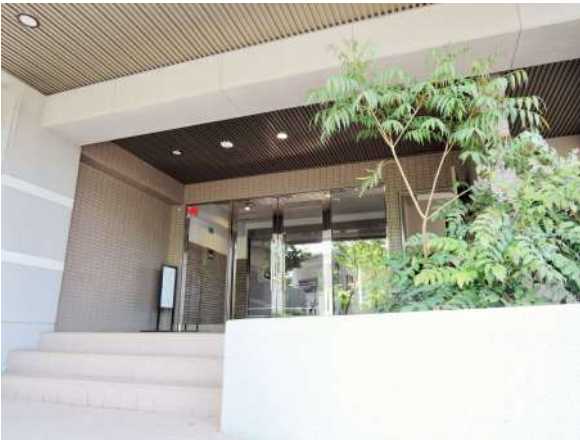
【エントランス(外)】マンション入口!