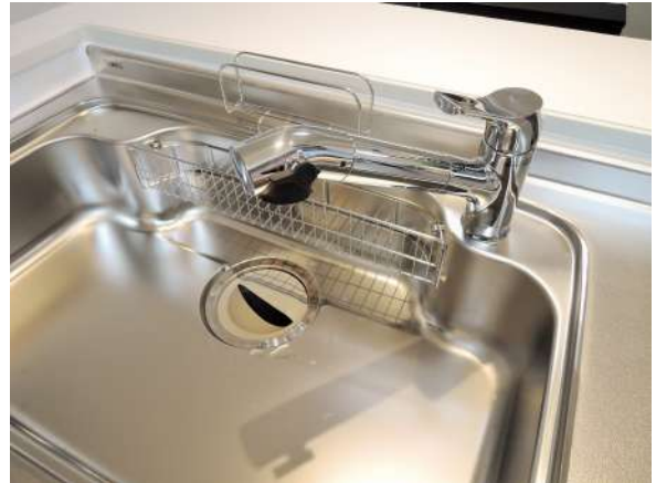
【その他設備】浄水器新調!