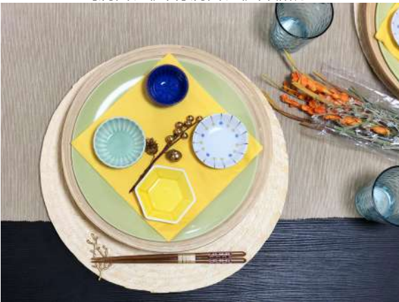
【ダイニング】ダイニング!