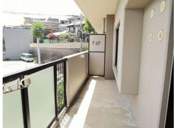
【バルコニー】風通し・日当たり良好!