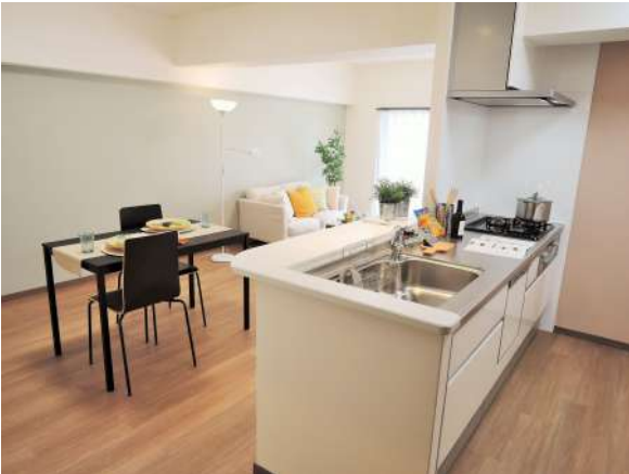
【居間・リビング】3LDK!全室レースカーテン・LED照明、リビングエアコン付