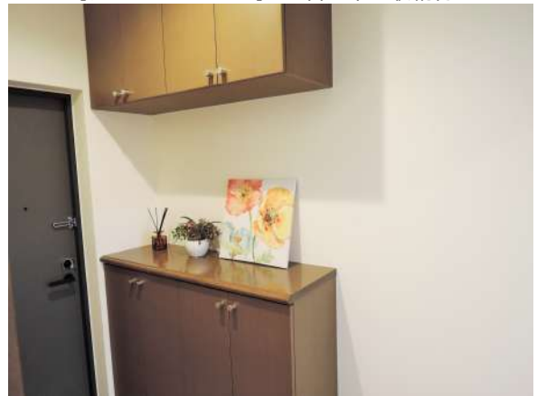
【玄関】下駄箱は上下収納有!