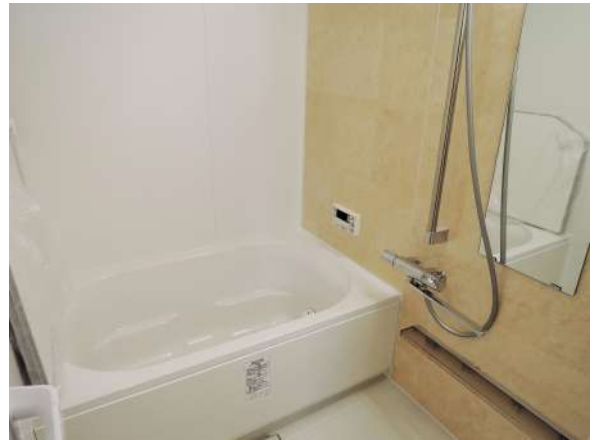
【浴室】ユニットバス(サイズ1317)新調!浴室暖房乾燥機付!