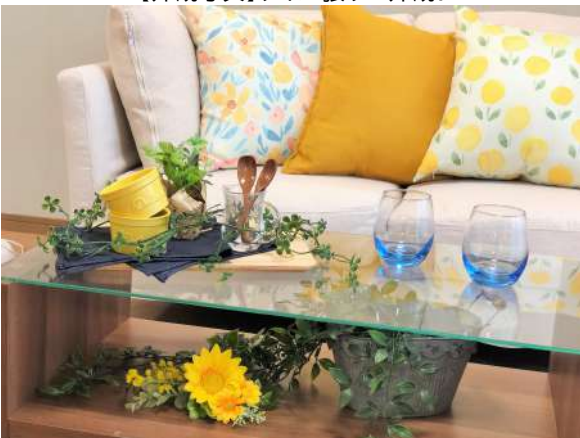
【居間・リビング】リビング!