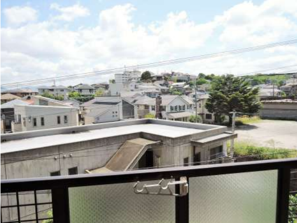
【バルコニー】マンションからの眺望です!