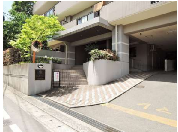
【エントランス(外)】エントランス外!