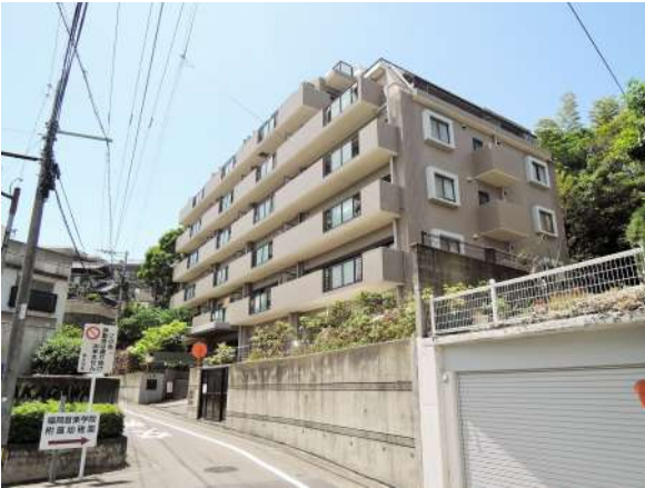
【外観写真】タイル張りの外観!