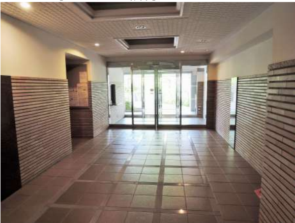
【エントランスホール】エントランス中!