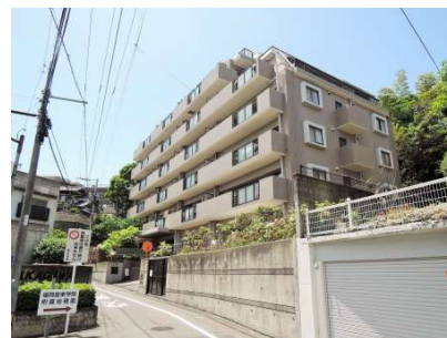
【外観写真】タイル張りの外観!