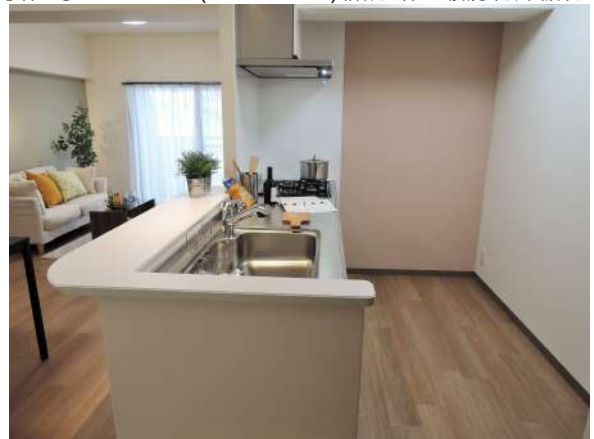
【キッチン】カウンター付システムキッチン!