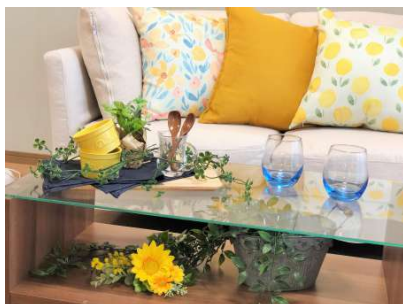
【居間・リビング】リビング!