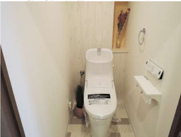
【トイレ】ウォシュレット付トイレ新調!