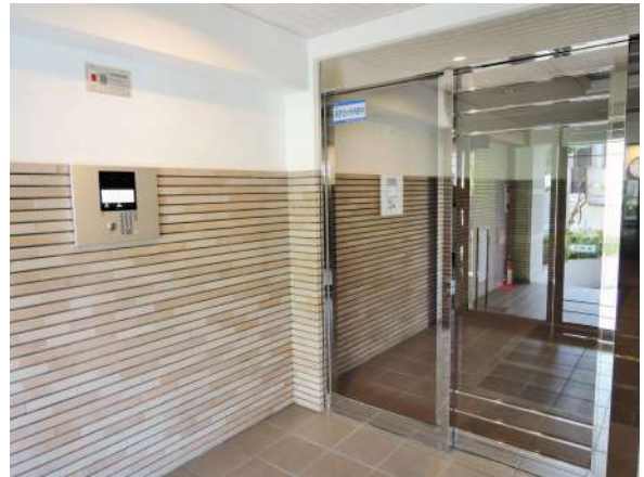
【その他共用部】オートック付き!