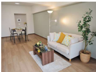
【居間・リビング】リビングは壁一面にアクセントクロス仕様!