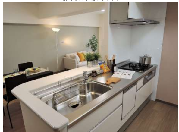
【キッチン】食洗器付システムキッチン新調!