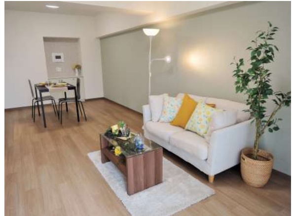
【居間・リビング】リビングは壁一面にアクセントクロス仕様!