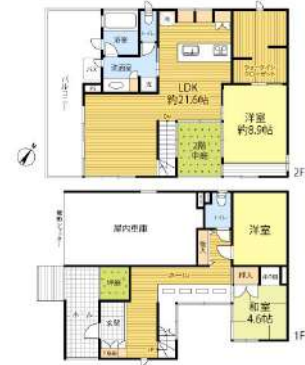
【間取り図】3LDK 電動シャッター付車庫