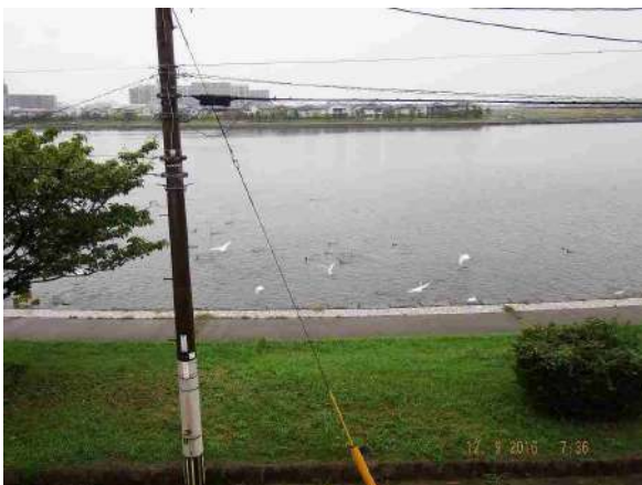
【その他】前面遊歩道の光景です。