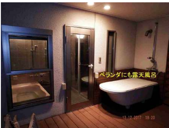
【浴室】ワイドバルコニーに設置された露天風呂