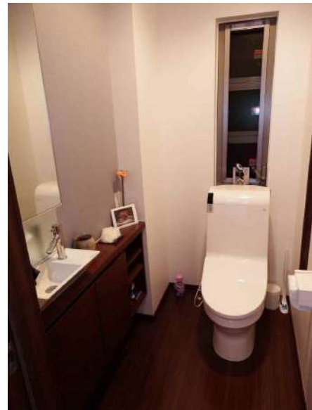
【トイレ】1階と2階に設置されています。