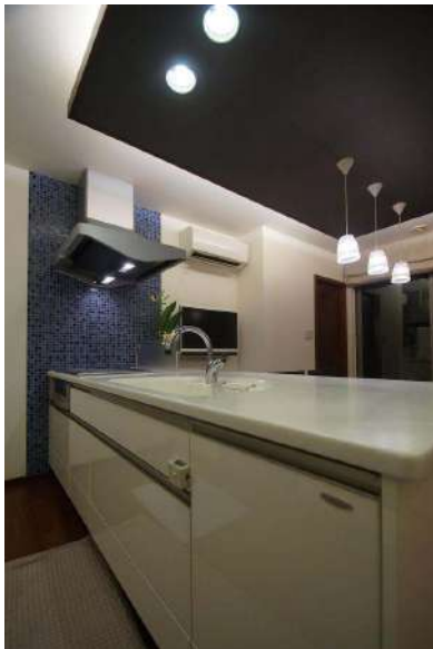
【キッチン】コンロはIH仕様となっています。