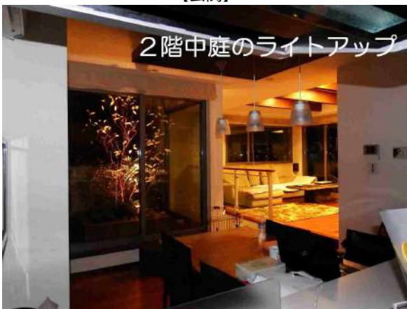
2階中庭のライトアップ