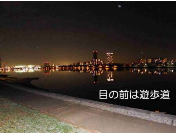
【眺望】対岸のアイランドシティの夜景をご覧ください。