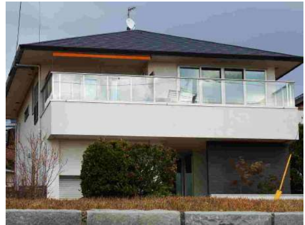
【外観写真】住友林業にて建築。