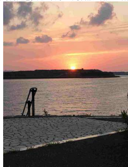
【その他】前面遊歩道からのサンセットです。