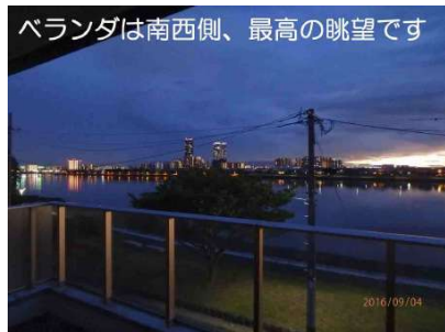
【眺望】オーシャンビューです。