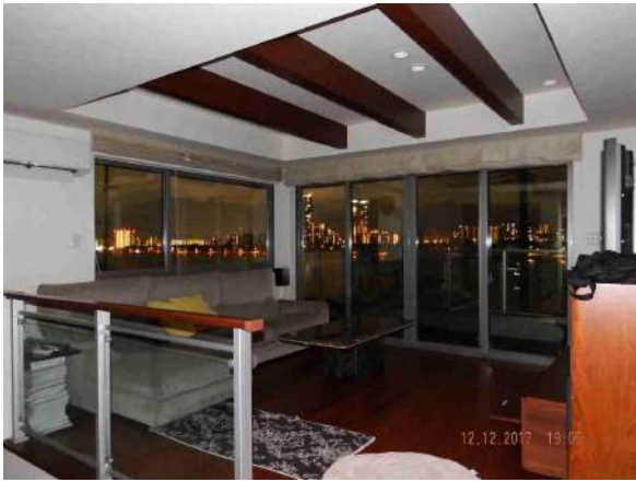
【居間・リビング】LDK約21帖