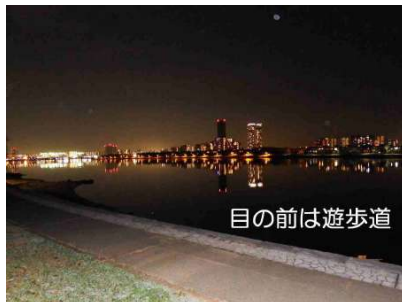
【眺望】前面には遊歩道が整備されています。