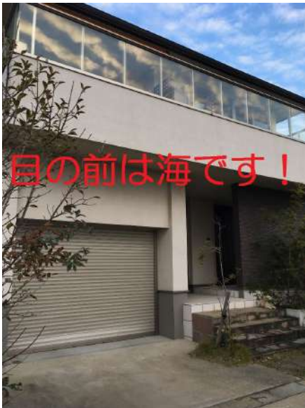
【外観写真】電動シャッター付車庫。