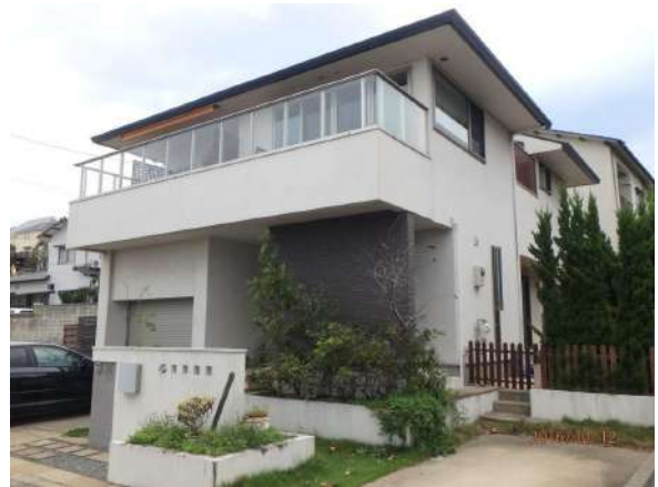
【外観写真】建物全景となります。