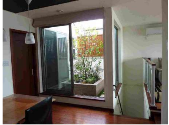
【庭】2Fダイニングからの中庭眺望です。