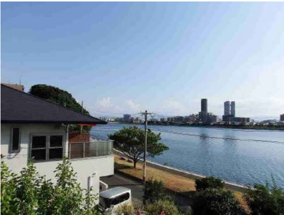
【外観写真】住友林業にて建築。オーシャンビューとなります。