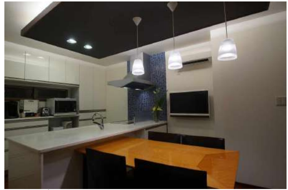
【ダイニング】ダイニングスペースとリビングスペースが分けられています。