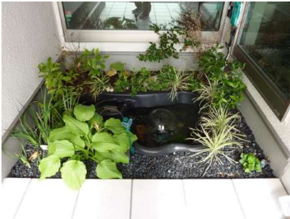
【庭】1階玄関横にも観賞用庭を設置。