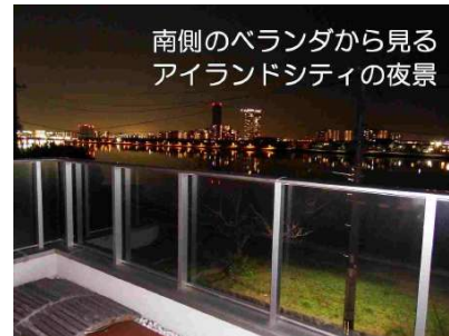
【眺望】南側のベランダから見るアイランドシティの夜景をご覧ください。