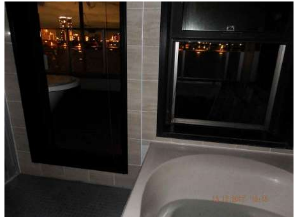
【浴室】バスルームからも夜景がご覧頂けます。