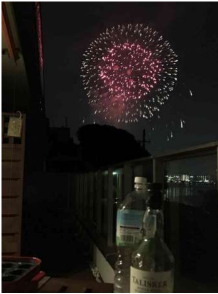
【その他】東区花火大会も鑑賞できます。