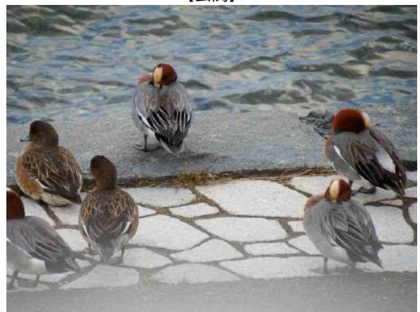
【その他】前面遊歩道の光景です。自然に戯れる瞬間です。