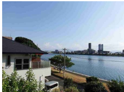
【外観写真】住友林業にて建築。オーシャンビュー 【間取り図】3LDK 電動シャッター付車庫となります。