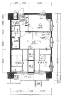
【間取り図】現況優先とします