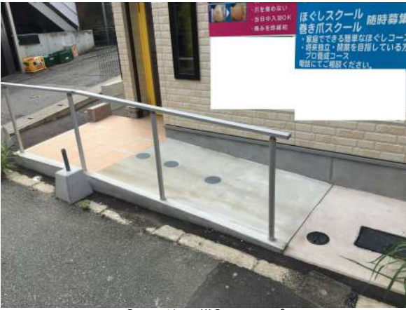
【その他設備】スロープ