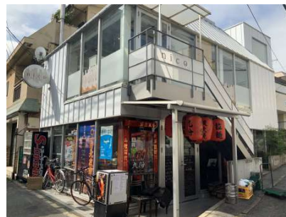
【外観写真】南側店舗