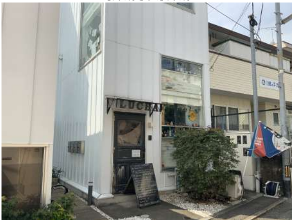
【外観写真】正面店舗