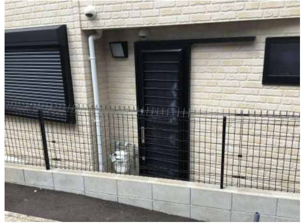
【その他共用部】勝手口