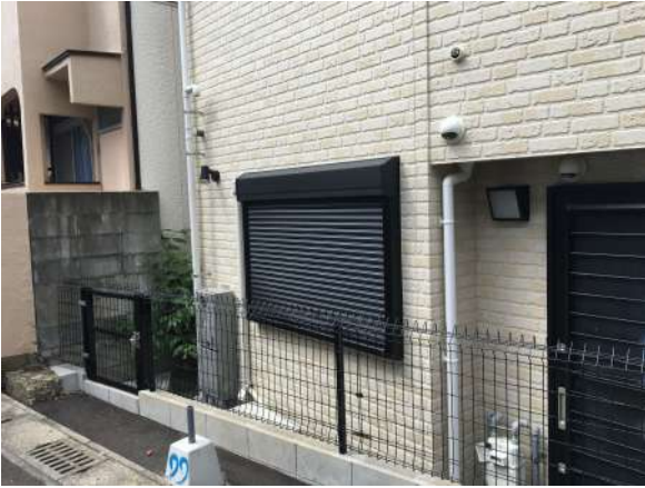
【外観写真】南シャッター