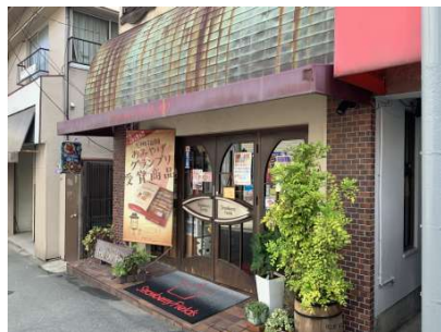
【外観写真】正面店舗