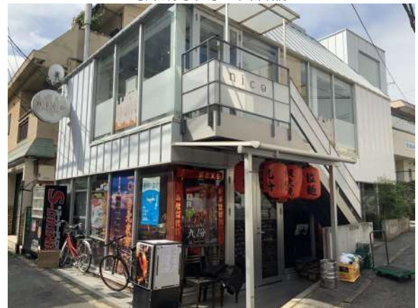
【外観写真】南側店舗