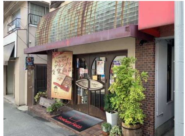
【外観写真】正面店舗