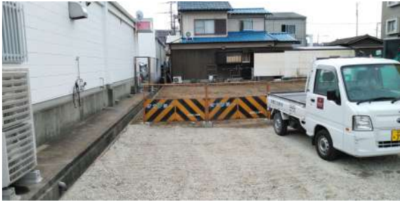
【現況写真】土地現況