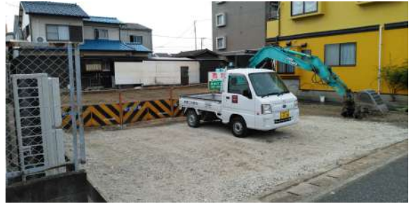
【現況写真】土地現況