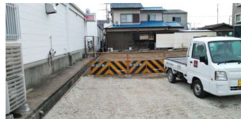
【現況写真】土地現況