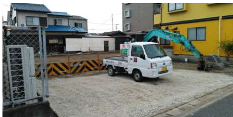
【現況写真】土地現況